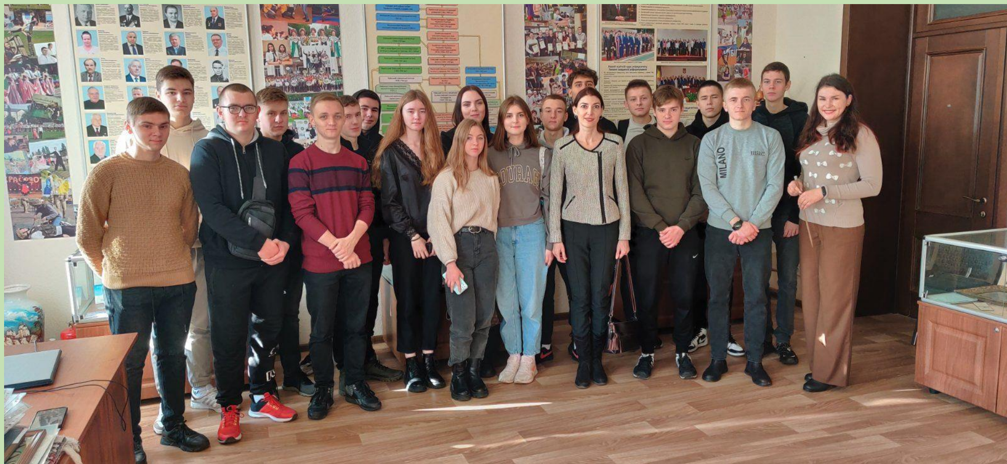
Відвідування Музею історії НУБіП України