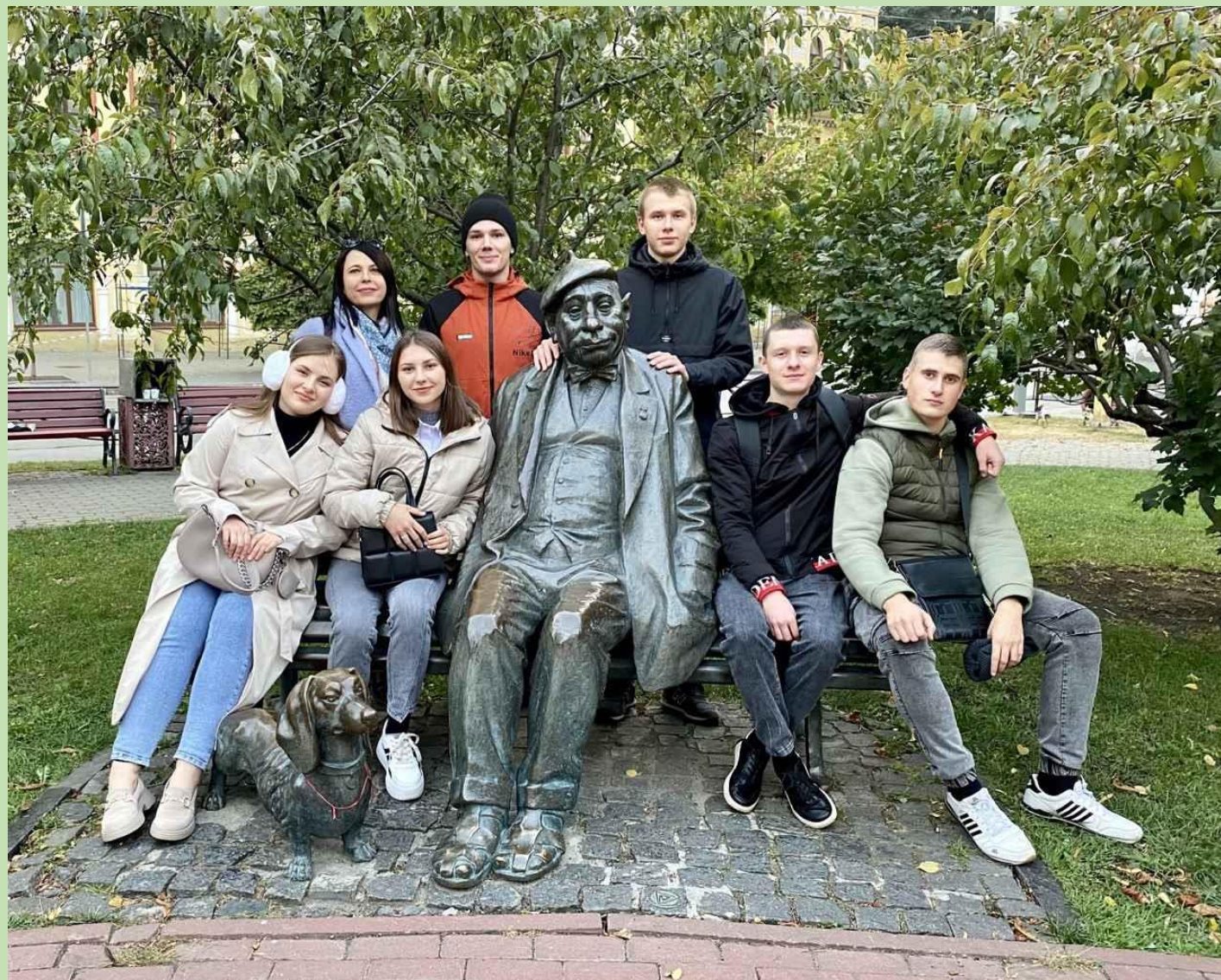
Жовтень 2023 р. Перед виставою «Кайдашева сім'я»