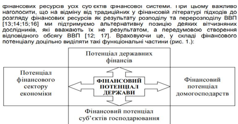
Рис. 1. Структура фінансового потенціалу держави* * Складено автором

ознака має якнайповніше охопити всю гамму фінансових відносин в економіці. На наш погляд, при виділенні складових фінансового потенціалу найдоцільніше розглядати його як сукупність фінансових ресурсів усіх суб'єктів фінансової системи. При цьому важливо наголосити, що на відміну від традиційних у фінансовій літературі підходів до розгляду фінансових ресурсів як результату розподілу та перерозподілу ВВП ми підтримуємо альтернативну позицію деяких вітчизняних дослідників, які вважають їх не результатом, а передумовою створення відповідного обсягу ВВП. Враховуючи це, у складі фінансового потенціалу доцільно виділяти такі функціональні частини (рис. 1.):