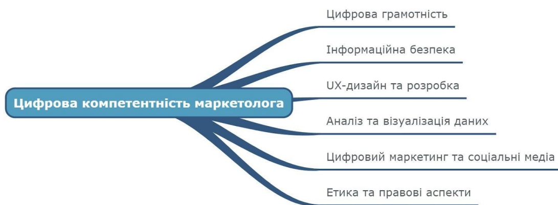
Рис. 1 Структура цифрової компетентності сучасного маркетолога

грамотності; з них 7,7% склали тест Цифрограма на рівень В1, а 90,1% – на на рівні В2, 2,2% – на рівні С1. Аналізуючи отримані результати, Т.Бережна, С. Заєць, С. Шибіріна зробили висновок, що у більшості студентів цифрові компетентності сформовані на середньому рівні [2]. На основі аналізу наукових публікацій, обговорень з професійними маркетологами, а також досвіду роботи зі студентами спеціальності “Маркетинг” визначено такі складові цифрової компетентності сучасних маркетологів: цифрова грамотність, інформаційна безпека, UX-дизайн та розробка, аналіз та візуалізація даних, цифровий маркетинг та соціальні медіа, етика та правові аспекти (рис. 1).