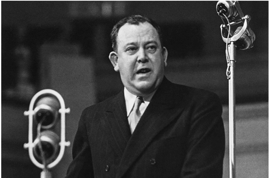
Трюгве Гальвдан Лі — норвезький політичний діяч, у період з 1946 по 1952 роки — 1-й вибраний Генеральний секретар ООН

24 жовтня 2024 року світова спільнота відзначає 79-у річницю створення Організації Об'єднаних Націй - найвпливовішої міжнародної організації, заснованої після закінчення Другої світової війни.