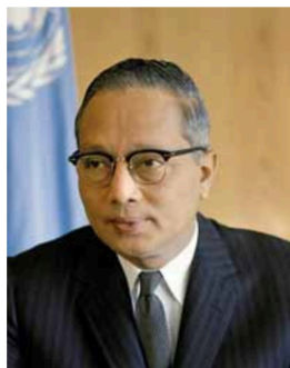
У Тан (М'янма)

Організація Об'єднаних Націй приділяє Україні постійну увагу, що підтверджується численними візитами Генеральних секретарів ООН. Україна мала честь вітати на своїй землі дев'ять візитів найвищих представників ООН: У Тана у 1962 році, Курта Вальдхайма у 1981 році, Переса де Куельяра у 1987 році, Бутроса Бутроса-Галі у 1993 році, Кофі Аннана у 2002 році, Бан Кі-муна у 2011, 2014 та 2015 роках, а також Антоніу Гутерріша у 2017 році.