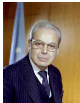
Хав'єр Перес де Куельяр (Перу)