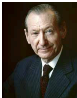
Курт Вальдхайм (Австрія)