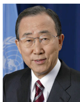
Бан Кі Мун (Республіка Корея)