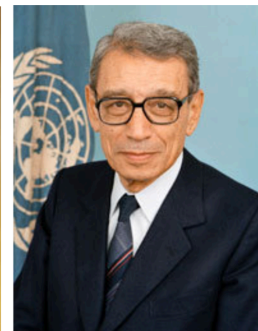
Бутрос Бутрос-Галі (Египет)