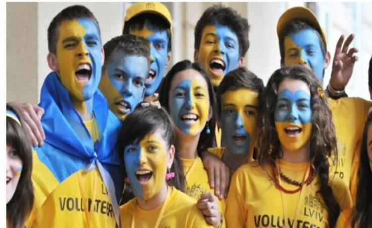
Європейська волонтерська служба