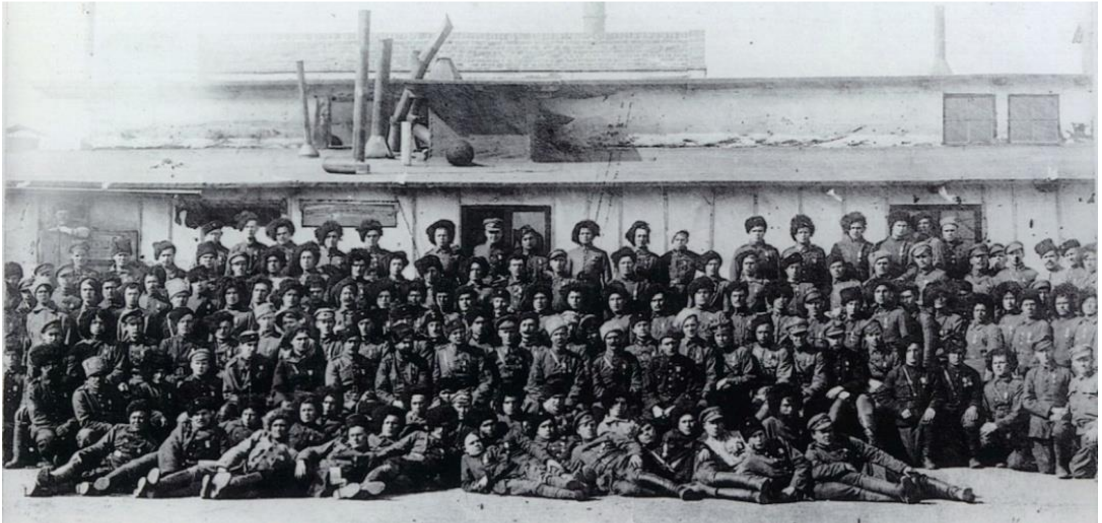
Фото 2-го кінного полку імені гетьмана Івана Мазепи.