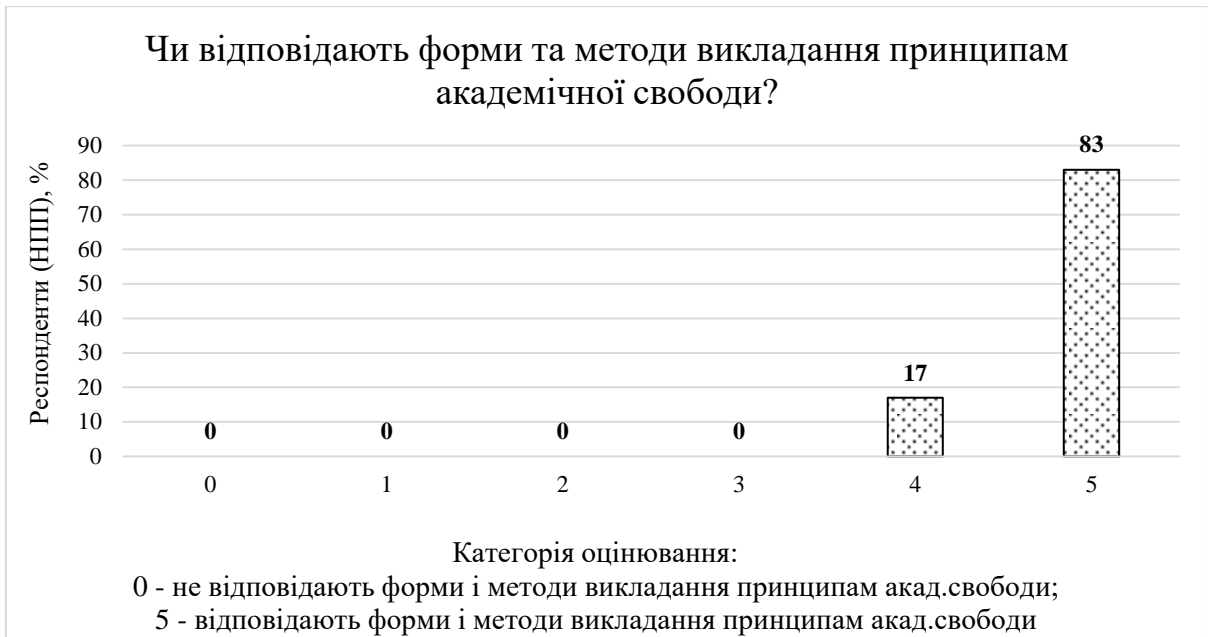
Рис. 2. Чи відповідають форми та методи викладання принципам академічної свободи?