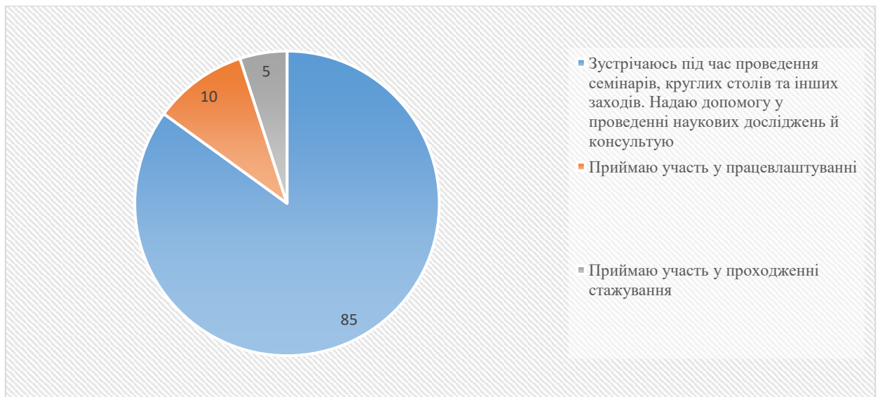
Рис. 2. Відповідь роботодавців на питання «У який спосіб у Вас налагоджені партнерські відносини з університетом та здобувачами третього (освітньо-наукового) рівня вищої освіти за спеціальністю 101 "Екологія"?»

Роботодавці позитивно оцінюють освітньо-наукову програму підготовки здобувачів третього рівня вищої освіти за спеціальністю 101 Екологія. Як ми можемо бачити із графіку (рис.3), 80% роботодавців вважають, що програма повністю відповідає сучасним вимогам підготовки здобувачів і потребам зовнішніх стейкхолдерів, 20% - програма потребує коригування відповідно до наданих вище пропозицій і рекомендацій.