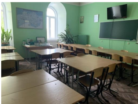
Прикладної екології та екологічного моніторингу