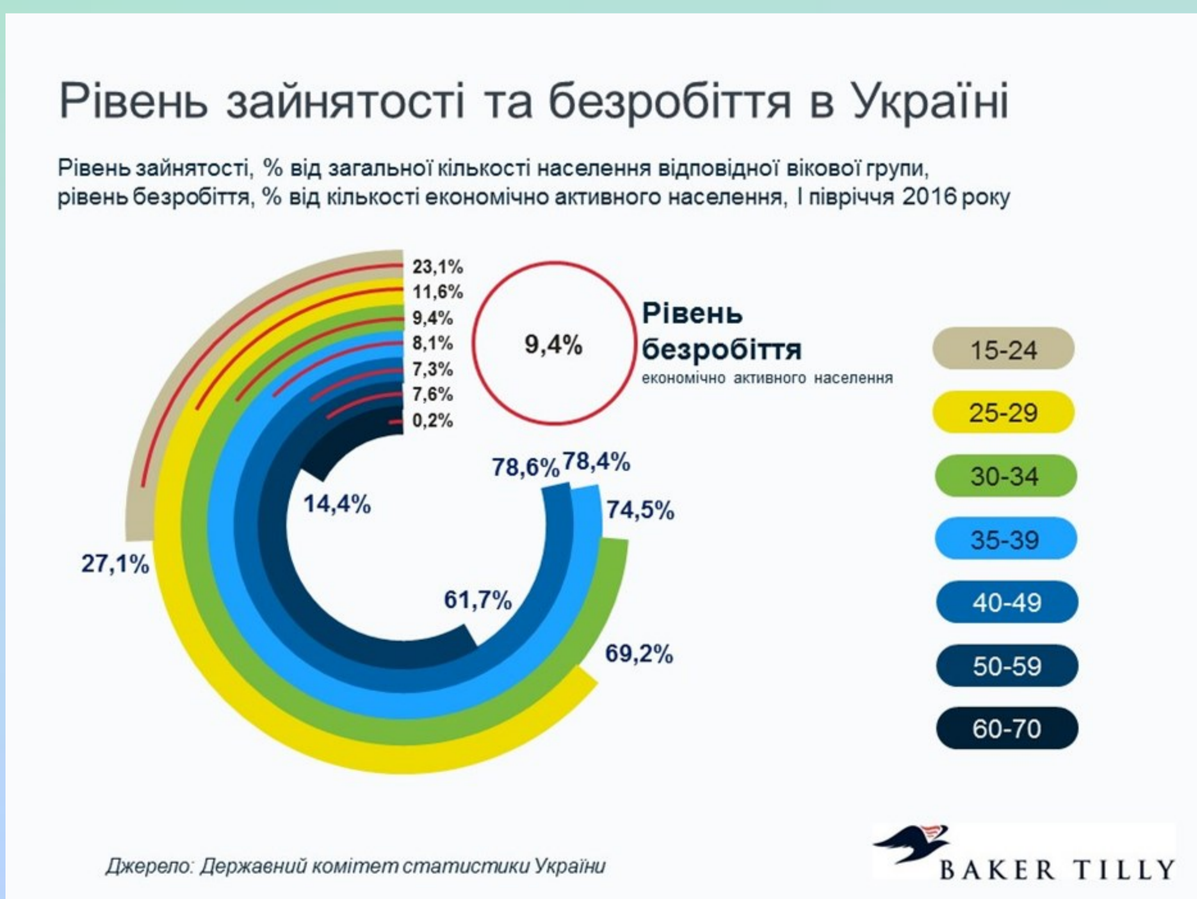
Рис. 3. Діаграма рівня зайнятості та безробіття в Україні

Своєю роботою я хочу звернути увагу на те що, у нашій країні в умовах пандемії дуже зростає рівень безробіття, особливо серед молоді. В сучасних умовах держава приділяє мало уваги створенню робочих місць та організації умов праці для випускників навчальних закладів, внаслідок чого вони змушені шукати роботу за кордоном.