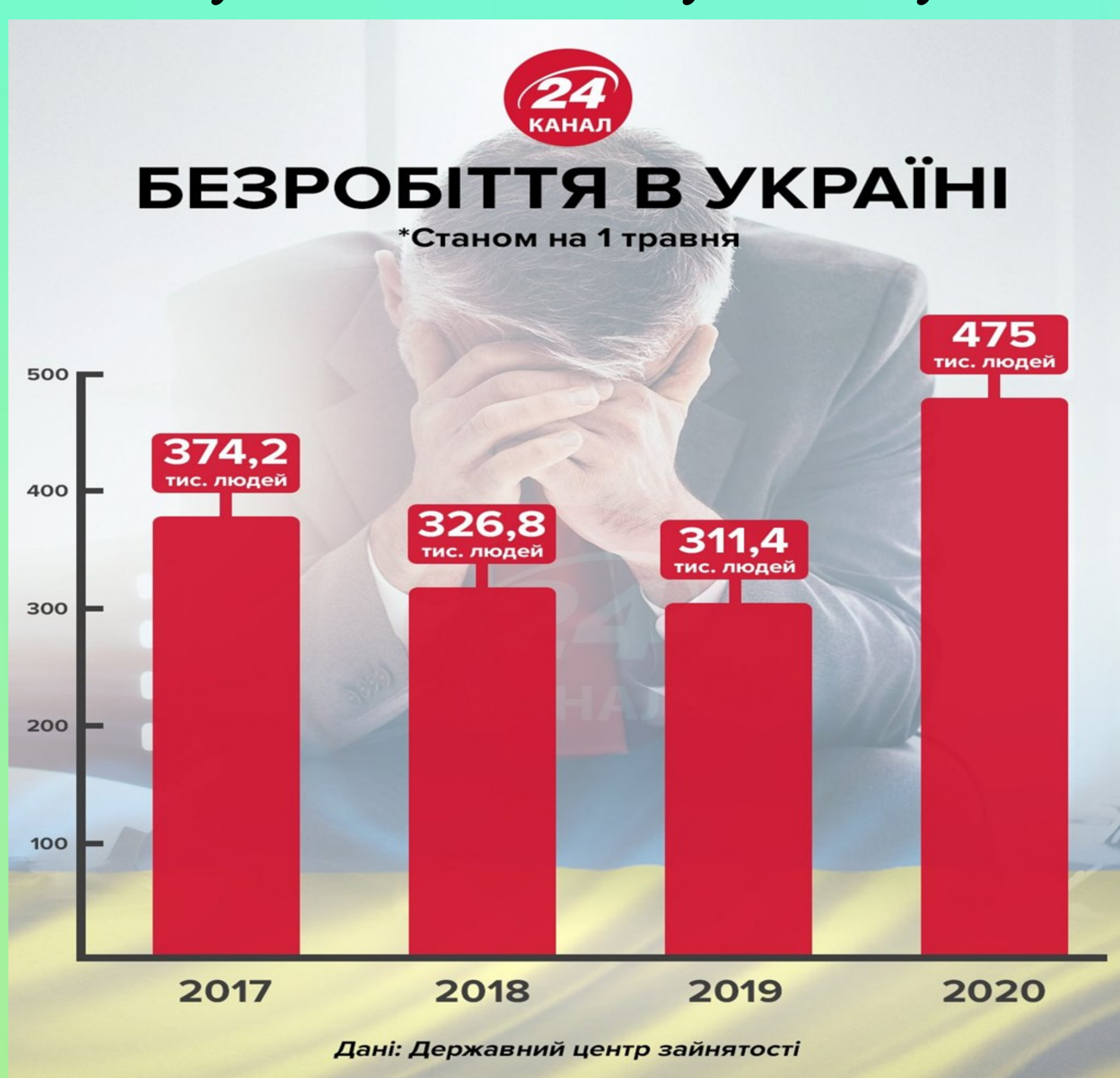
Рис. 2. Рівень безробіття в Україні станом на 1 травня