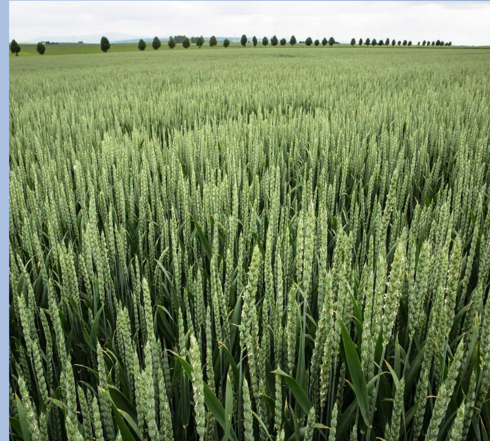
Рис. 1. Пшениця дворучка