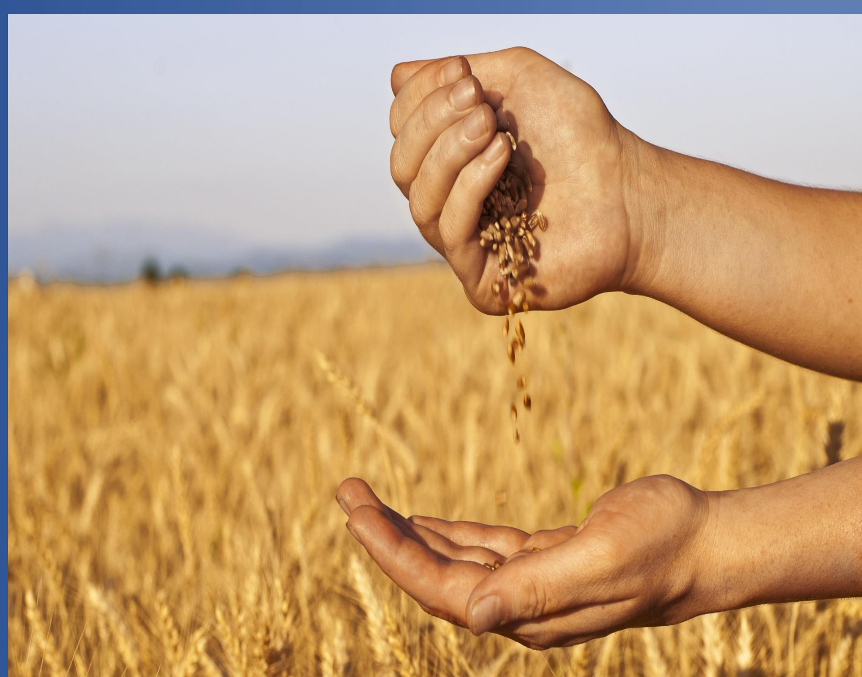
Рис. 2. Якість зерна вирощеного в Україні