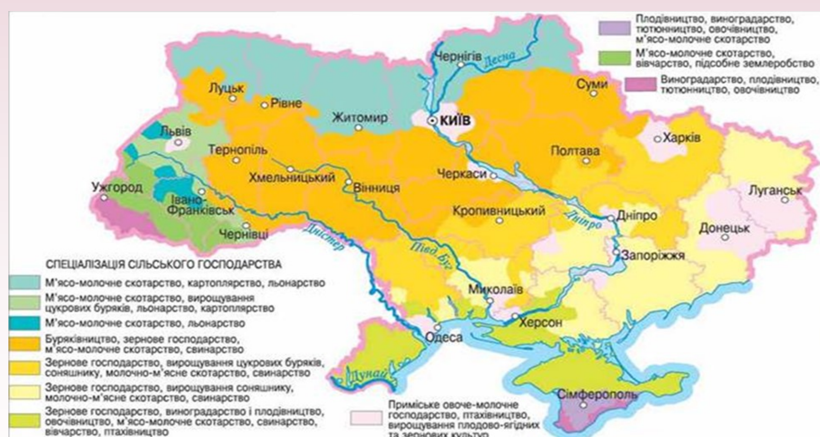
Рис.1.1. Територіальна спеціалізація сільського господарства

ОБ'ЄКТ ДОСЛІДЖЕННЯ: аналіз окремих аспектів розвитку сільського господарства та перспективи розвитку.