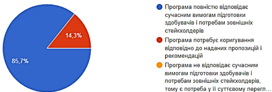
Рис. 3. Відповідь роботодавців на питання «Як Ви оцінюєте освітньо-наукову програму підготовки здобувачів третього рівня вищої освіти за спеціальністю 206 «Садово-паркове господарство»?»

85,7 % роботодавців вважають, що програма повністю відповідає сучасним вимогам підготовки здобувачів і потребам зовнішніх стейкхолдерів, 14,3% - програма потребує коригування відповідно до наданих вище пропозицій і рекомендацій.