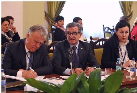
Сергій Тарута Голова наглядової ради Інституту глобальних трансформацій, народний депутат України