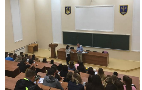
доктор Хенк Доннерс професор Маастрихтського університету, екс-міністр фінансів Королівства Нідерланди