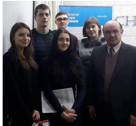
Семинар-тренінг «Заповнення заявок для розміщення в системі Enterprise Europe Network» за програмою COSME