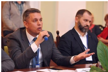
Олег Ткаченко голова правління ПАТ «Українська біржа»