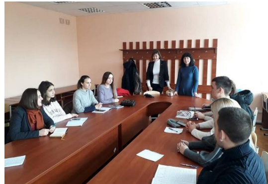
Рольова гра «Negotiations» («Перемовини»)