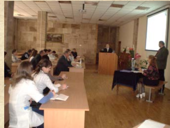
Звітно-виборча конференція молодих вчених