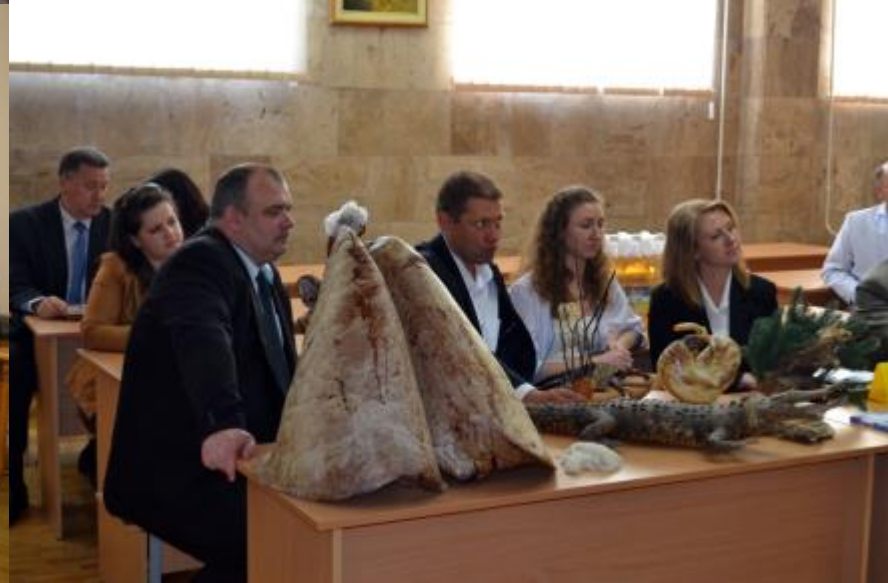
Фестиваль студентської науки