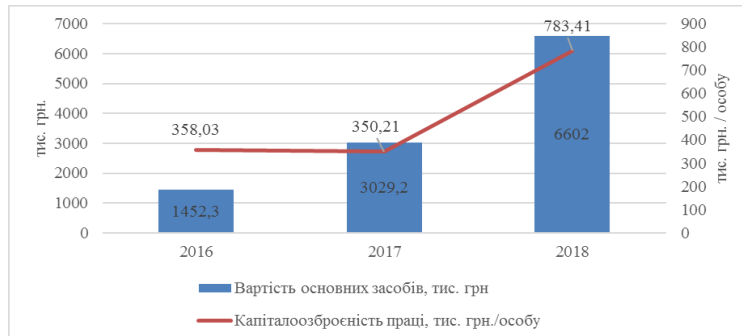
Рисунок 1. Наявність основних засобів на сільськогосподарських підприємствах Оратівського району Вінницької області

За даними рис. 1 у досліджуваному регіоні наявність основних засобів на сільськогосподарських підприємствах у 2017 р. становила 3029,2 тис. грн., що на 3572,8 тис. грн. більше, порівняно з 2018 р. Капіталоозброність праці у 2018 р. на рівні 783,41 тис. грн./особу, зважаючи на майже незмінну чисельність працівників, за аналізований період приріст середньорічної вартості основних засобів збільшився майже в 2 рази порівняно з 2016 роком. Тому слід вважати, що збільшення значення показників, завдячують поповненням складу основних засобів підприємства.