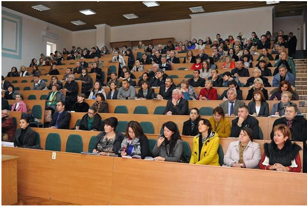
Світлина 2. Один із Інфоднів у НУБіП.