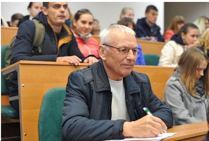
Світлина 10. Один із Інфоднів у НУБіП.