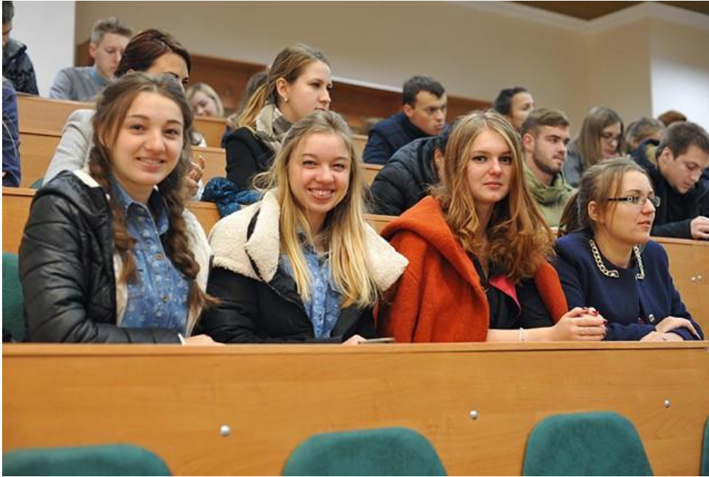
Світлина 6. Один із Інфоднів у НУБіП