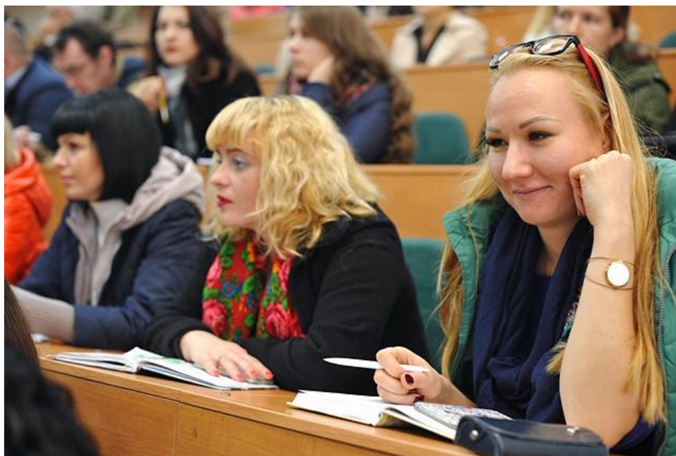
Світлина 5. Один із Інфоднів у НУБіП.

Британський університет працює над пропозицією проекту, спрямованого на створення нових біоматеріалів для використання в медичних технологях, що вимагають роботи в екстремальних умовах, або ворожому оточенні. Проект буде спрямована на загоєння ран, тканинну інженерію, для доставки лікарських засобів і медичних пристроїв. Дослідження будуть спрямовані на створення унікального поліпротеїну гідрогелю зі специфічними біологічними функціями, що спричинює динамічні зміни в механічних і структурних властивостях у відповідь на біомолекулярні зміни (реплікації). Це буде досягнуто за рахунок міждисциплінарних досліджень, основаних на фізичному підході, який трансформує знання про нанорозмірні біофізичні властивості згорнутих білків до мезомасштабної структури з новими функціями для використання у поліпротеїновому гідрогелі. Це забезпечить широкий дослідницький спектр в галузі фізики м'яких матерії, біофізики і визначить нові цікаві напрямки в області створення гідрогелю. Для участі в проекті потрібні партнери, що працюють з антимікробними гідрогелями для профілактики інфекцій, лікування ран в екстремальних температурних умовах або з хімічними речовинами для боротьби з загоєнням ран в догоспітальному та доклінічному періоді.»