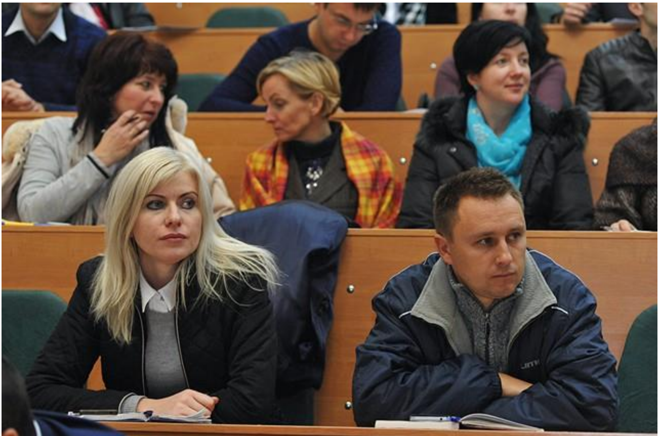
Світлина 9. Один із Інфоднів у НУБіП