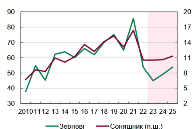
Урожай зернових та соняшнику, млн. т

Надалі продовження війни призвело до погіршення стану промисловості. Причини цьому: безпекова ситуація (постійні обстріли окупантами цивільної і виробничої інфраструктури), труднощі із логістикою, а також брак обігових коштів. В прифронтових зонах підприємства змушені призупиняти виробництво.