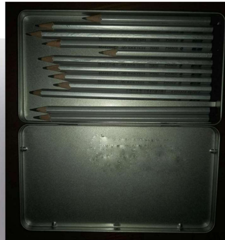
Набір олівців у короці