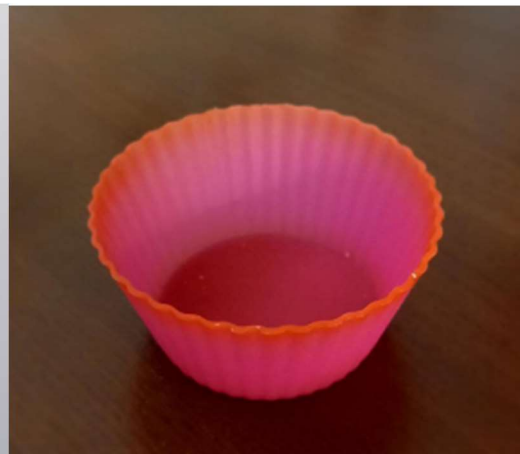
Форма для десерту