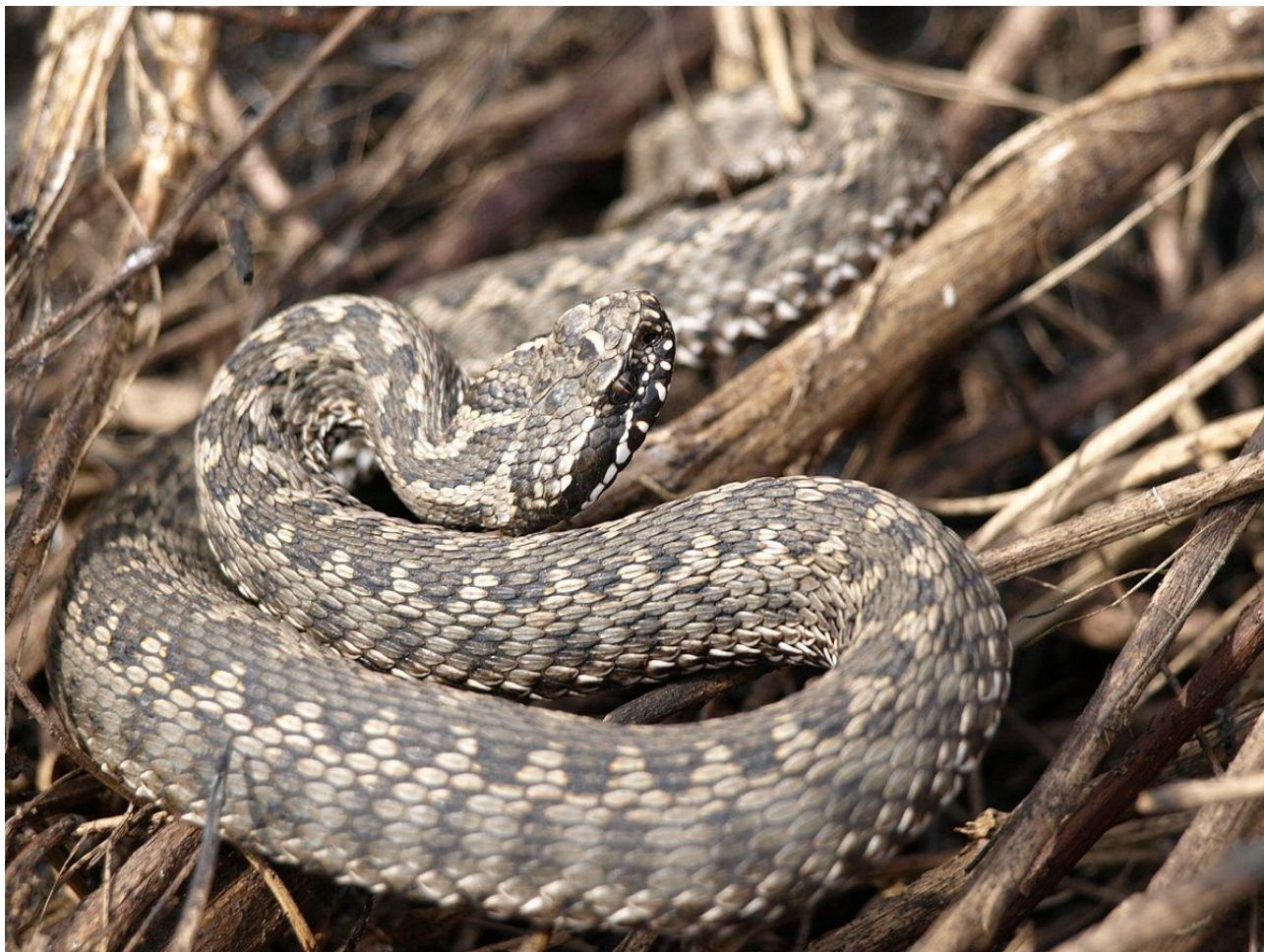
Гадюка степова. Фото з відкритих джерел