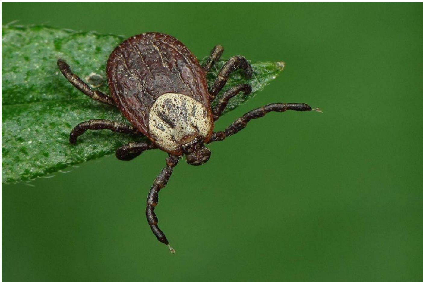
Укусив кліщ – терміново зверніться до лікаря.