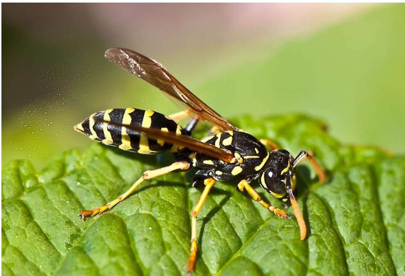
Місце укусу оси можна обробити слабким розчином оцту.