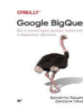
«Google Analytics Thin Edition Joe Teixeira» from L. Ledford and Mary Tyl