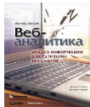
Веб-аналітика: аналіз інформації про відвідувачів веб-сайтів. Авінаш Кошик, 2010