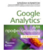
«Google Analytics для професіоналів» от Брайана Клифтона