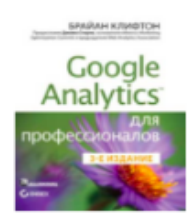
«Google Analytics для професіоналів» от Брайана Клифтона