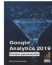
«Google Analytics 2019: Полное руководство» от Якова Осипенкова