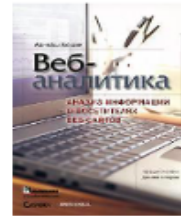
Веб-аналітика: аналіз інформації про відвідувачів веб-сайтів. Авінаш Кошик, 2010