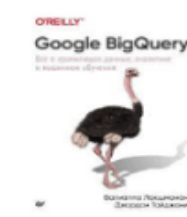
«Google Analytics Thin Edition Joe Teixeira» from L. Ledford and Mary Tyl