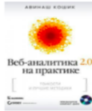
Веб-аналітика 2.0 на практиці. Тонкощі і кращі методики. Авінаш Кошик, 2012