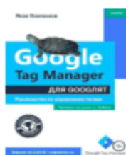
«Google Tag Manager для Google Analytics» от Якова Осипенкова