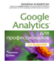
«Google Analytics для професіоналів» от Брайана Клифтона