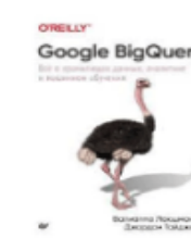
«Google Analytics Thin Edition Joe Teixeira» from L. Ledford and Mary Tyl