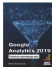
«Google Analytics 2019: Полное руководство» от Якова Осипенкова