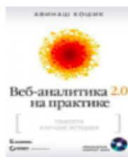
Веб-аналітика 2.0 на практиці. Тонкощі і кращі методики. Авінаш Кошик, 2012