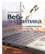
Веб-аналітика: аналіз інформації про відвідувачів веб-сайтів. Авінаш Кошик, 2010