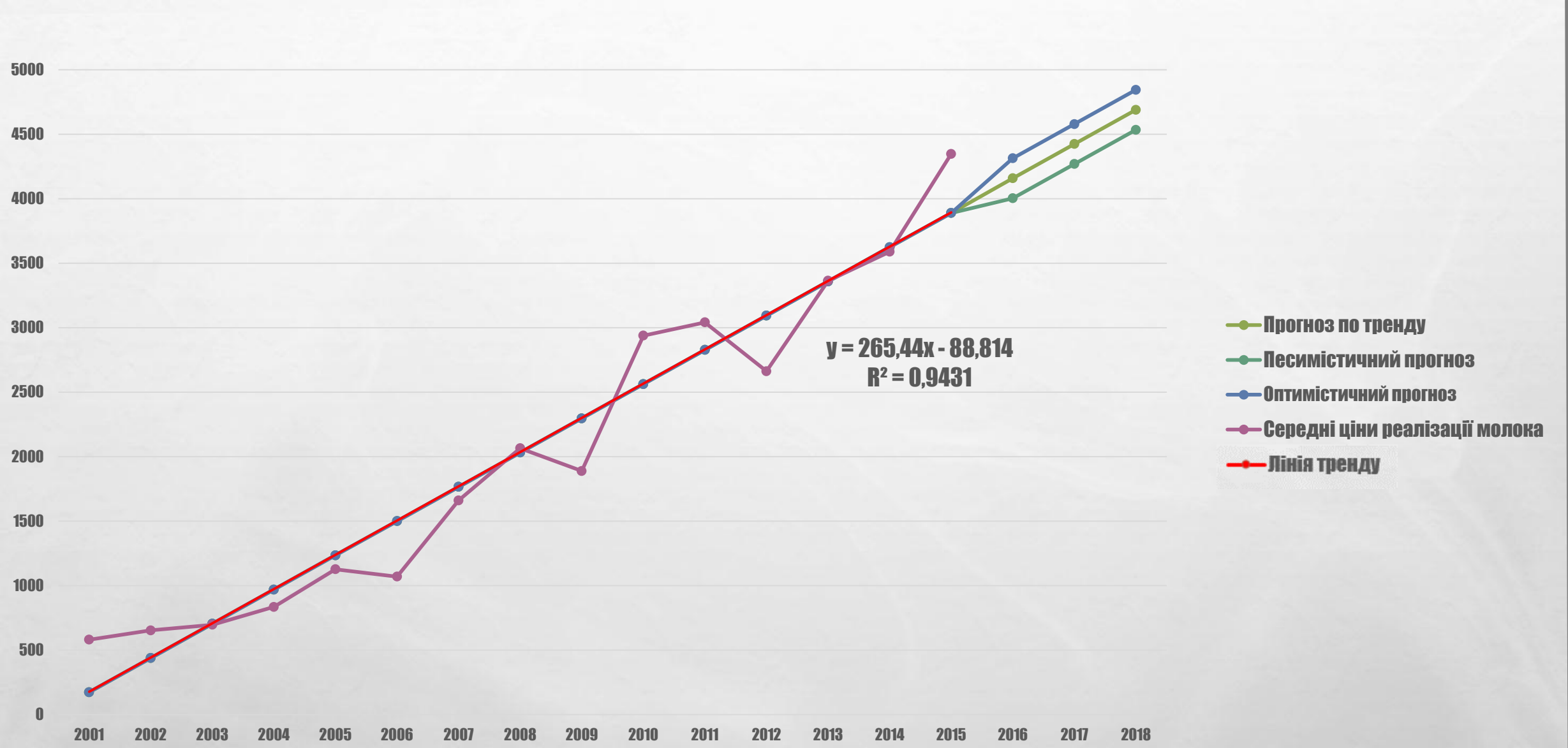
Рис. 4. Середні ціни реалізації молока за 2001-2015 рр. та прогноз, тис. грн за т.