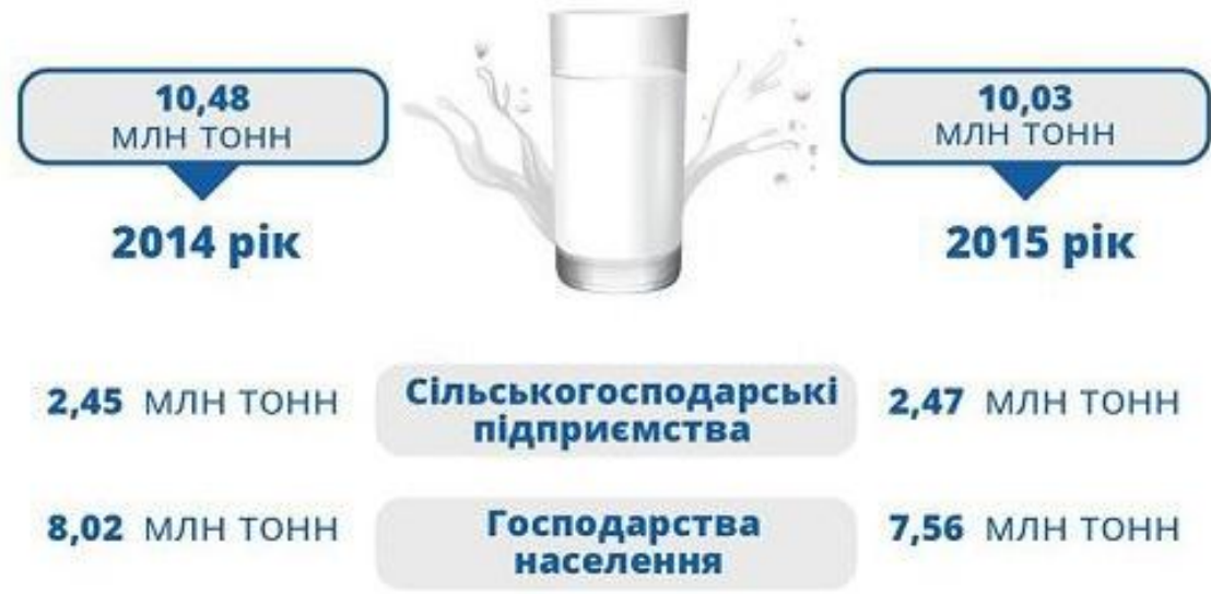
Рис. 2. Динаміка виробництва молока за 2014-2015 рр.

МОЛОКО ВИРОБЛЯЄТЬСЯ В НАШОЇ СТРАНИ ІЛИ ІНШИМ НАСЕЛЕННЯМ ЧАСТИНА ЙОГО ЦЕ МОЛОКО