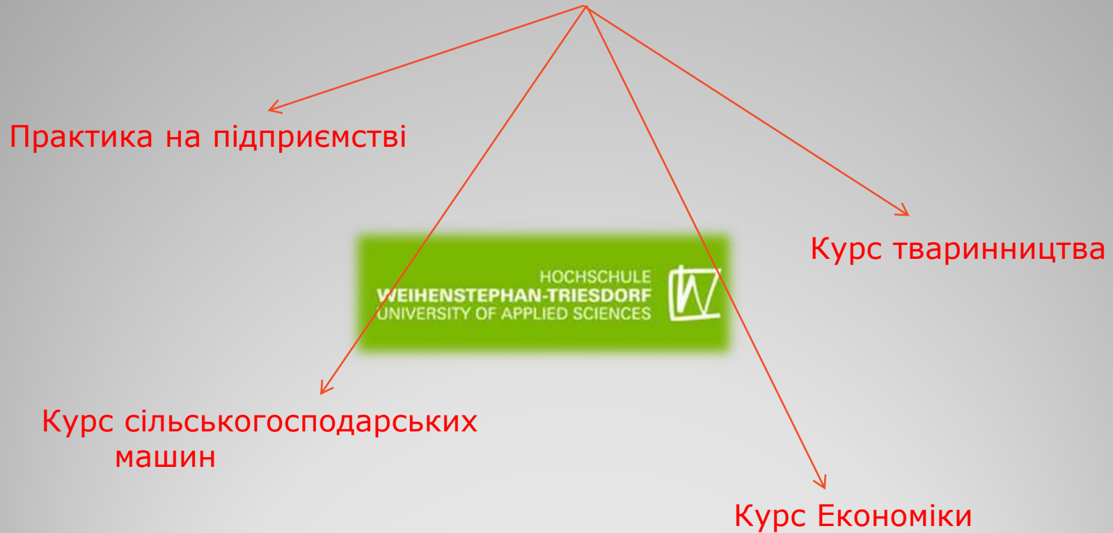
Схема виробничої практики