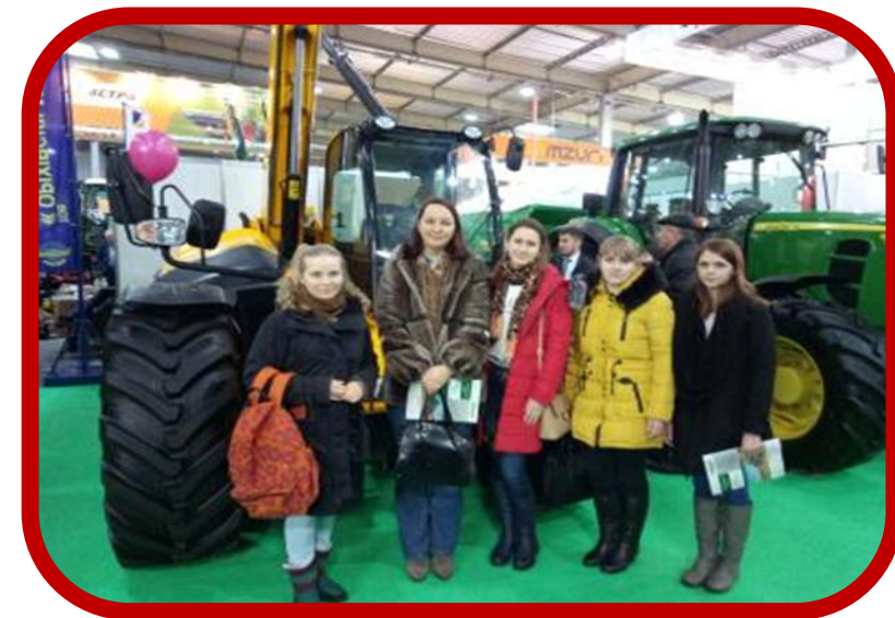
Зернові технології – 2017. Овочі. Фрукти. Логістика.