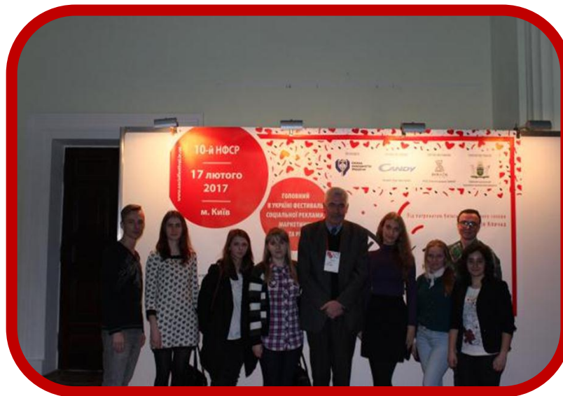
Фестиваль Соціальної реклами