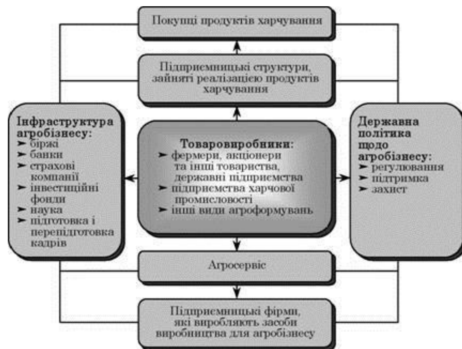
Система економічних відносин в агробізнесі