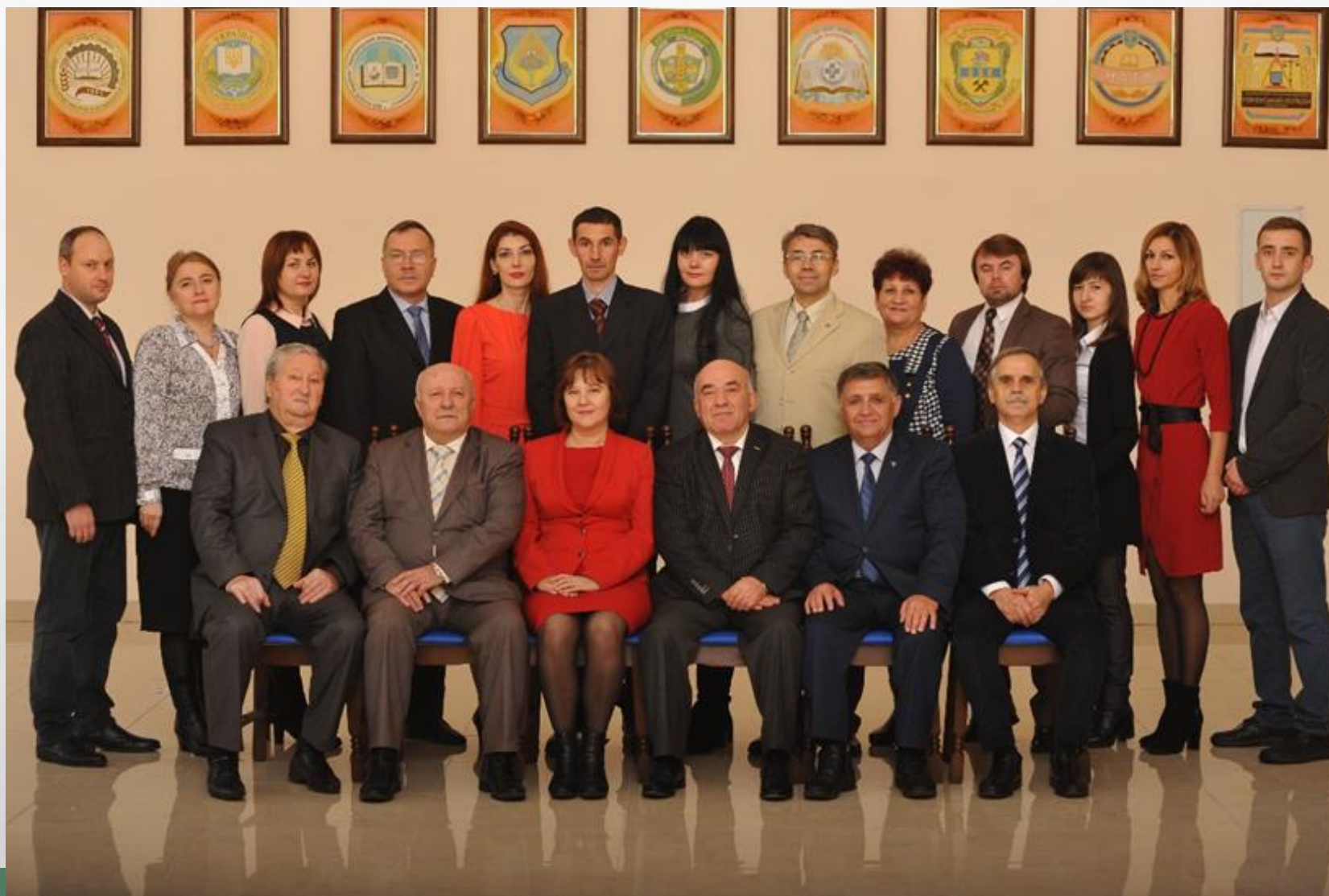
Колектив кафедри, 2017 рік