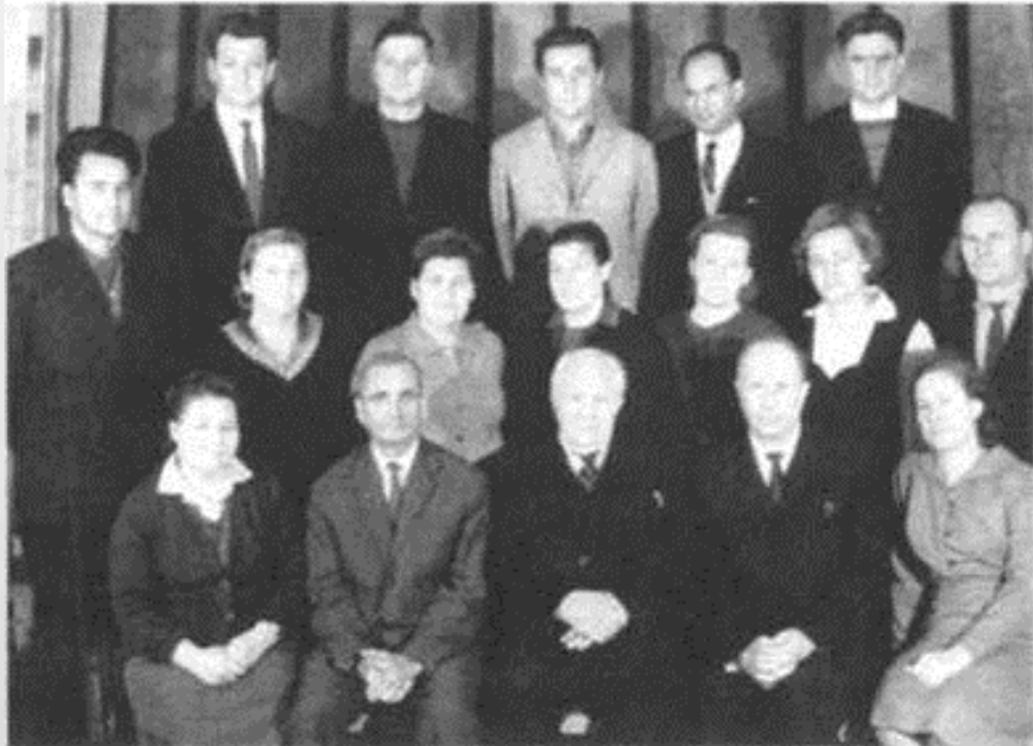
Колектив кафедри, 1966 р.

На кафедрі досліджували генезис ґрунтів рівнинних і гірських територій України (Карпати), вивчали процеси ерозії ґрунтів середнього Придніпров'я, досліджували умови залягання торфових ґрунтів та якість їх органічної речовини.