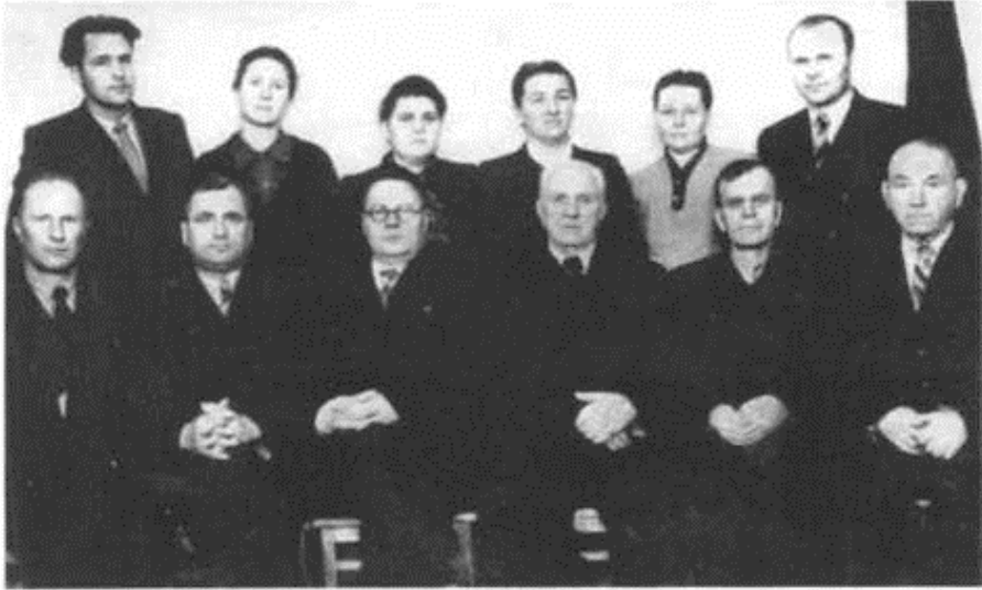
Колектив кафедри у 1956 р.