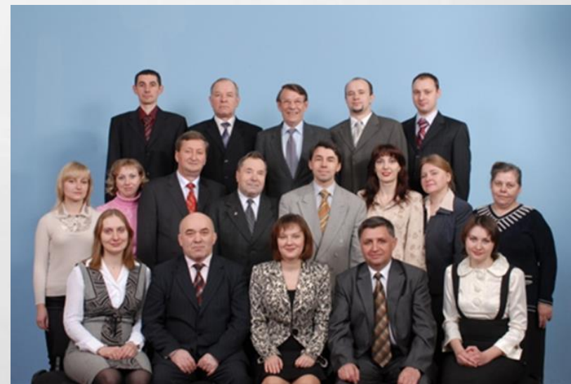
Колектив кафедри, 2008 р.