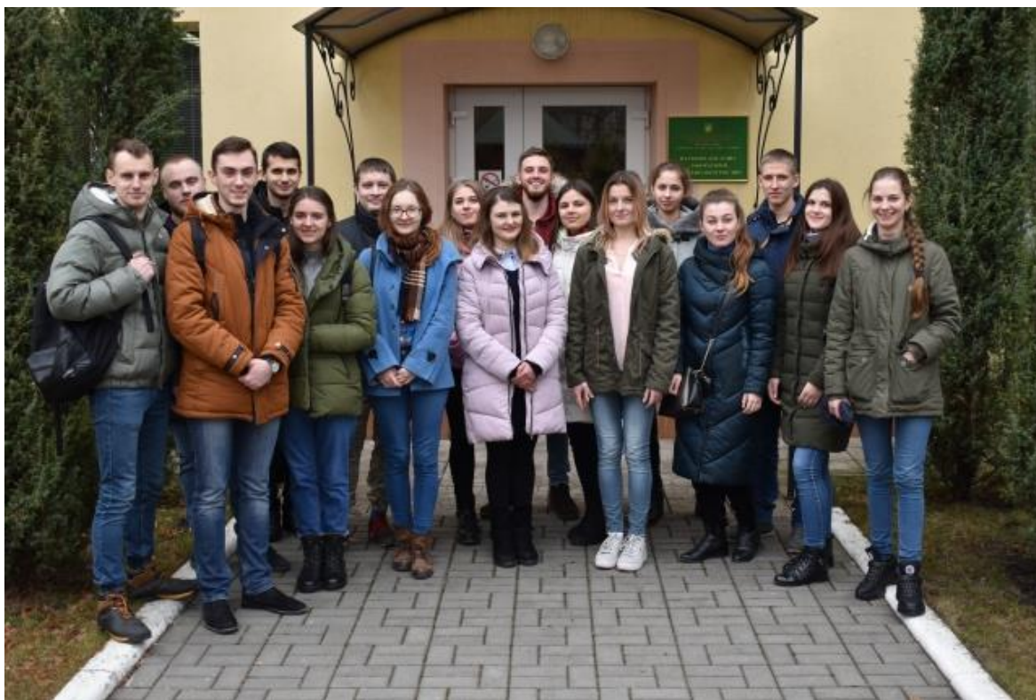
Рис. 16. Учасники семінару біля входу до наукової частини Боярської ЛДС

станції, стали гуртківці СНГ «Відтворення лісів» і «Декоративне розсадництво» - майбутні магістри, які навчаються за «Відтворення лісів та лісових меліорацій» та «Декоративне розсадництво» ( https://nubip.edu.ua/node/71732 ).