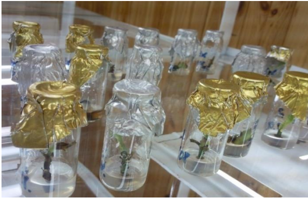
Рис.1. Відділеннями мікроклонального деревних рослин

зібрань класиків лісівників (рис.4). Як і минулі роки традиційними є навчально-наукові та науково-практичні виїзні семінари на базі ВП НУБіП України «Боярська ЛДС» та кращих галузевих лісгосподарських підприємств і установ, активна участь гуртківців з метою апробації своїх наукових здобутків в роботі Всеукраїнських і Міжнародних наукових конференціях.