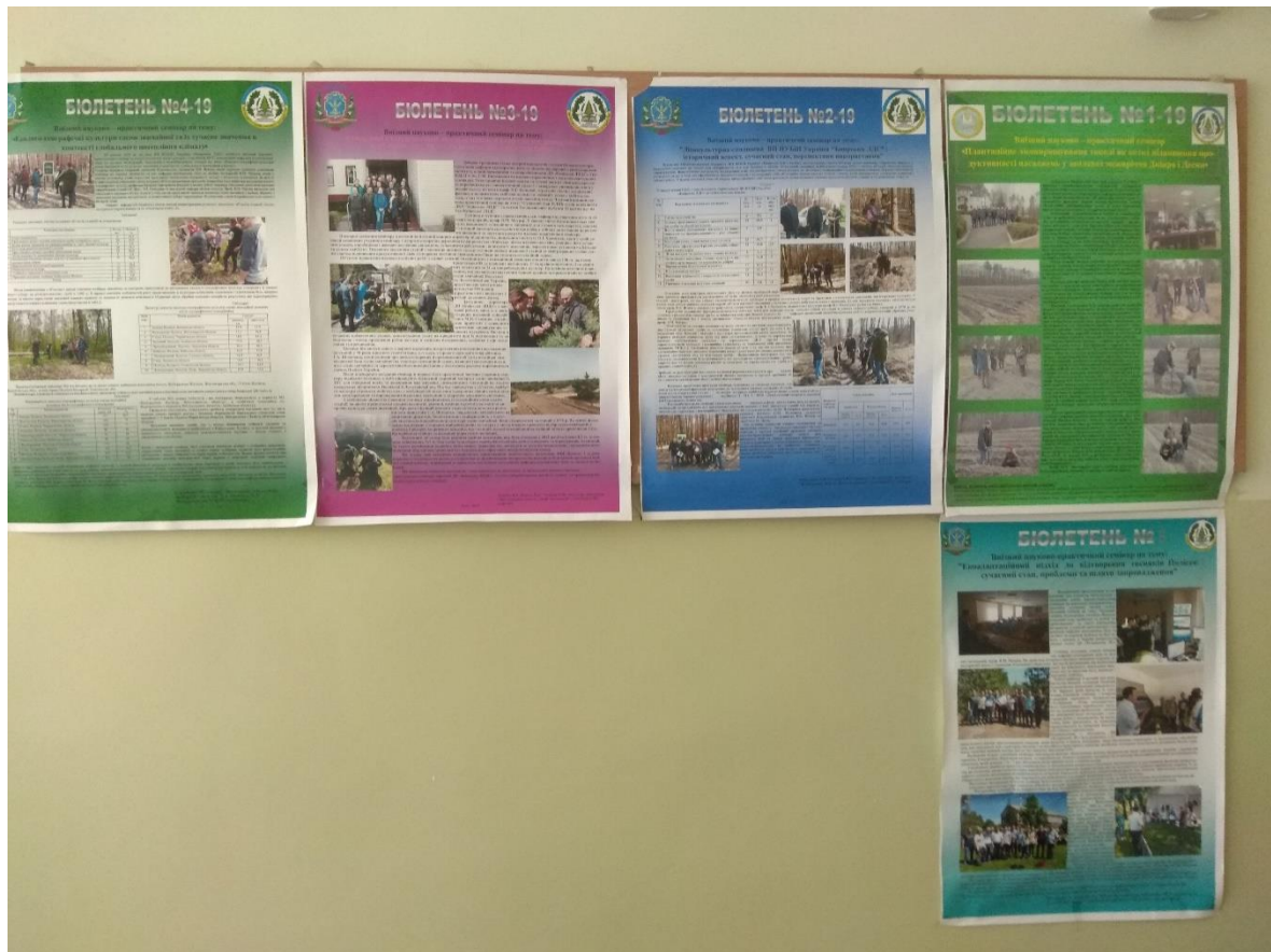
Рис. 20. Науково-інформаційні бюлетені СНГ кафедри за результатами виїзних науково-практичних і навчально-наукових семінарів

- за результатами проведених виїзних семінарів підготували та випустили 5 науково-інформаційних бюлетенів СНГ кафедри (рис.20);