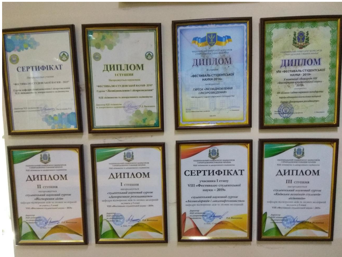
Рис. 21. Нагороди студентського наукового гуртка «Відтворення лісу»

Основними проблемами у діяльності студентського наукового гуртка кафедри є: