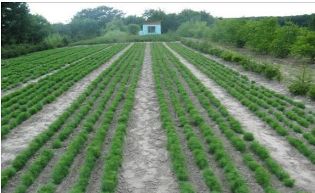
Рис.3. Посівне відділення навчально-зібрань дослідного розсадника кафедри