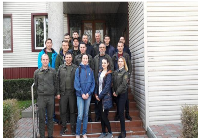
Рис.12. Фото на згадку з гостинними господарями: керівниками, співробітниками і дипломниками кафедри минулих років

6-8 листопада 2019 р. відбулася Міжнародна науково-практична конференція «Відтворення лісів та лісова меліорація в Україні: витоки, сучасний стан, виклики сьогодення та перспективи в умовах антропоцену», присвячена 100-річчю кафедри відтворення лісів та лісових меліорацій, підготовці і проведенні якої активну участь прийняли і гуртківці СНГ кафедри.