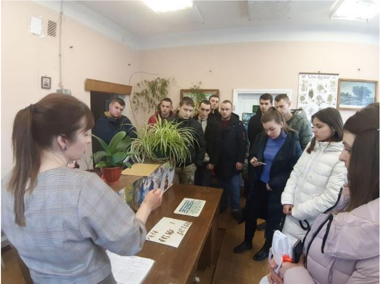
Рис.19. Ліс починається з якісного насіння, а про секрети визначення посівної якості насіння з гуртківцями на семінарі щедро ділилися співробітники лісового селекційного центру

Навесні, у лютому-березні, гуртківці активно готували наукові тези для участі у традиційній Всеукраїнській студентській науково-практичній конференції на базі ННІ лісового і садово-паркового господарства: «Науковий пошук молоді для сталого розвитку лісового комплексу та садово-паркового господарства». Загалом 17 гуртківців прийняли участь надіславши свої наукові тези на адресу організаційного комітету.