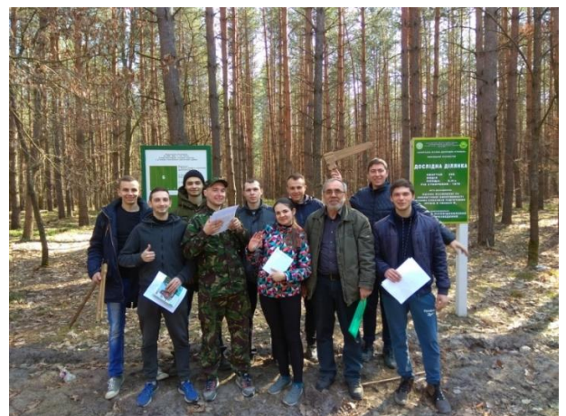
Рис.7. Фото на пам'ять після дослідження еколого-географічних культур сосни