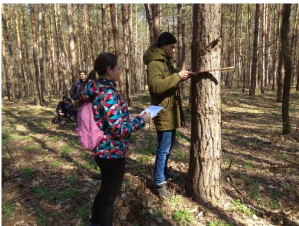
Рис.6. Дослідження дослідних культур сосни на ділянках з різною підготовкою зрубів

Більш ніж 120 річна наукова спадщина ВП НУБіП України «Боярська ЛДС» налічує загалом понад тисячу об'єктів та має неабияку теоретичну цінність і практичне значення не тільки для підприємства та України у цілому, а й для наукової роботи гуртківців. В науковій спадщині найбільшою (понад 40%) є частка об'єктів лісокультурного спрямування. Вона охоплює всі аспекти відтворення лісів: від насінництва і розсадництва до штучного та природного відновлення сосняків. Наукове значення їх посилюється ще й тим, що ефективність більшості заходів з відтворення лісів об'єктивно можна оцінити тільки з часом, який вимірюється десятками, а інколи і сотнею років ( https://nubip.edu.ua/node/71539 ). Щорічно гуртківцями спільно з викладачами кафедри, науковцями і виробничниками станції проводиться 4 – 7 виїдних науково-практичних або навчально наукових семінарів.