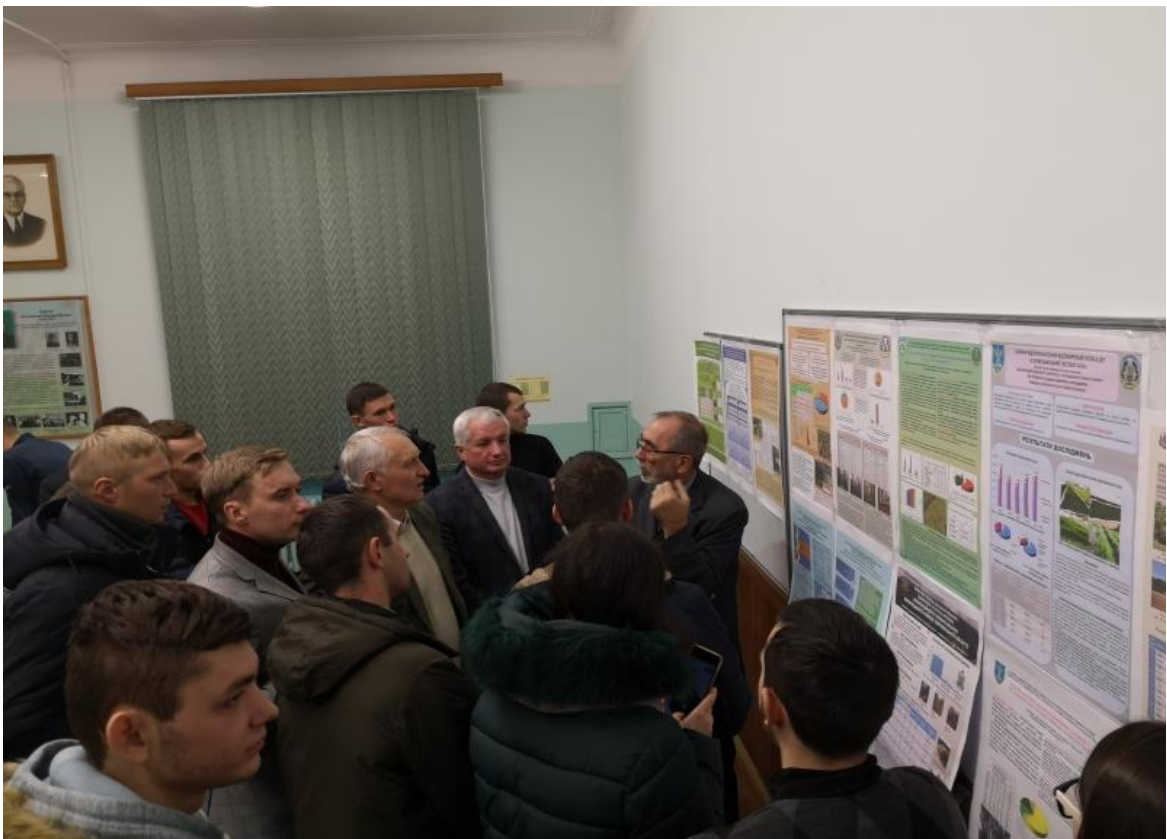
Рис.15. Наукова дискусія викладачів і гуртківців-магістрів під час постерної конференції результатів власних досліджень у 102 аудиторії