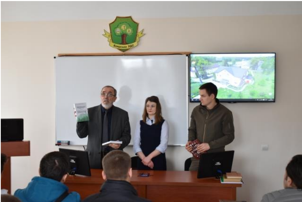
Рис. 17. Відкриття навчально-наукового семінару у науковій бібліотеці Боярській ЛДС

Окрім того учасники семінару відвідали ДО «Український лісовий селекційний центр». У рамках заходу студенти заслухали лекцію щодо організації постійної лісонасінневої бази, ознайомилися із напрямками діяльності структурних підрозділів та відвідали відділи лісового насінництва і лісопатології.