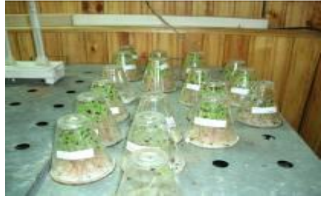
Рис.2. Відділення контролю розмноження якості лісового насіння