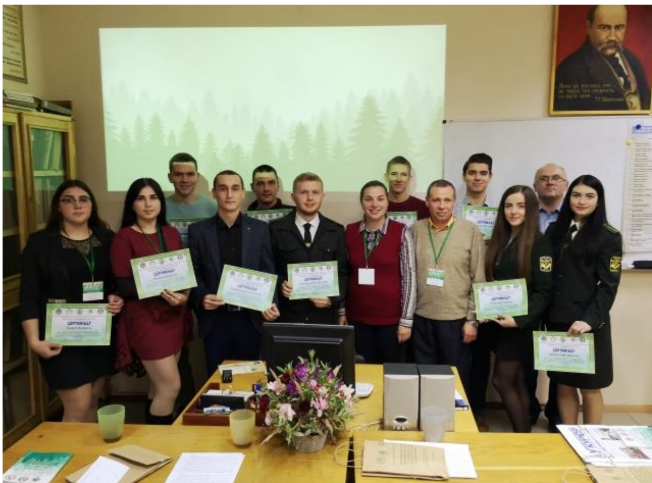
Рис. 14. Гуртківці-переможці після роботи секційного засідання Міжнародної науково-практичної конференції, присвяченій 100-річчю к-ри відтворення лісів та лісових меліорацій