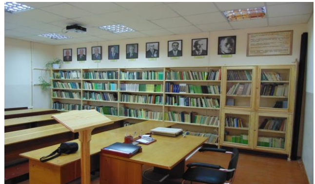
Рис.4. Фахова бібліотека з особистих класиків лісівників

І у звітному році зміцнилася матеріальна база кафедри. НПП кафедри розробили проект будівлі навчально-наукової лабораторії на території розсадника, наявність якої суттєво покращить умови для навчальної діяльності студентів ННІ та наукової роботи гуртківців кафедри. Враховуючи розмір будівлі, звернулися за допомогою до наших випускників-гуртківців, котрі зараз працюють у держлісгоспах Закарпаття, і вони допомогли заготовити, оциріндрувати дерев'яний брус та змонтувати дерев'яний зруб на 130 квадратних метрів (рис.5).