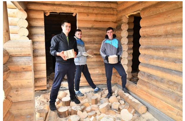
Рис. 5. Загальний вигляд будівлі навчально-наукової лабораторії на території навчально-дослідного деревного розсадника кафедри. Справа допомога гуртківців

Більш ніж 120 річна наукова спадщина ВП НУБіП України «Боярська ЛДС» налічує загалом понад тисячу об'єктів та має неабияку теоретичну цінність і практичне значення не тільки для підприємства та України у цілому, а й для наукової роботи гуртківців. В науковій спадщині найбільшою (понад 40%) є частка об'єктів лісокультурного спрямування. Вона охоплює всі аспекти відтворення лісів: від насінництва і розсадництва до штучного та природного відновлення сосняків. Наукове значення їх посилюється ще й тим, що ефективність більшості заходів з відтворення лісів об'єктивно можна оцінити тільки з часом, який вимірюється десятками, а інколи і сотнею років ( https://nubip.edu.ua/node/71539 ). Щорічно гуртківцями спільно з викладачами кафедри, науковцями і виробничниками станції проводиться 4 – 7 виїдних науково-практичних або навчально наукових семінарів.