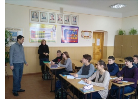
Чернівецька Загальноосвітня школа I -III ступенів № 8 (11 листопада 2016 р.)