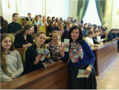
Осіння школа для абітурієнтів «Юний менеджер» (27 жовтня 2016 р.)