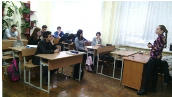
Заліщицька державна гімназія Спеціалізована школа ім. О.С.Маковця (Тернопільська область) (18 листопада 2016 р.)