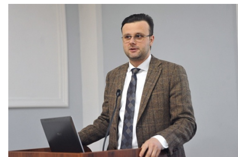
Віктор Галасюк народний депутат України, голова Комітету Верховної Ради України з питань промислової політики та підприємництва