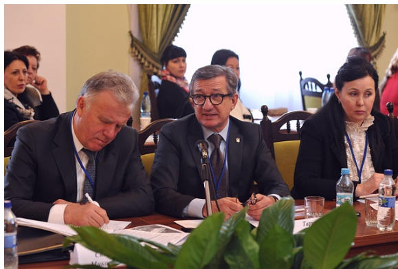
Сергій Тарута Голова наглядової ради Інституту глобальних трансформацій, народний депутат України