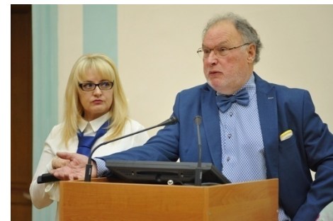
Доктор Хенк Доннерс , екс-міністр фінансів Королівства Нідерланди, консультант Кабінету Міністрів України з питань оподаткування