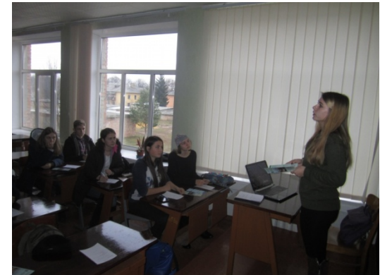
Ватутінська спеціалізована школа I- III ступенів №1 Черкаської області Миронівська загальноосвітня школа I-III ступенів №3 Київської області (18 листопада 2016 р.)