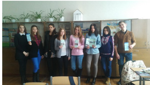
Спеціалізована загальноосвітня школі I-III ступенів №105 (м. Київ) (15 грудня 2016 р.)