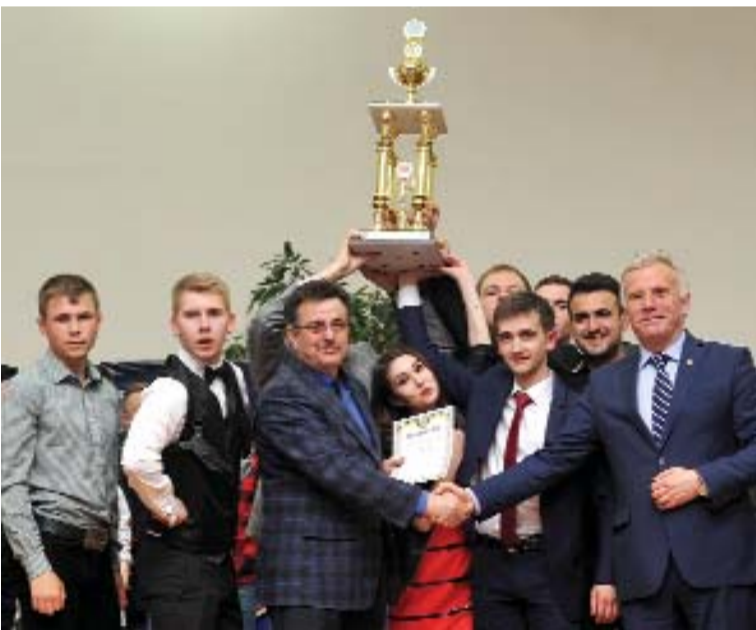
Кубок XV університетського чемпіонату КВН виборола команда "Каністра" механіко-технологічного факультету.