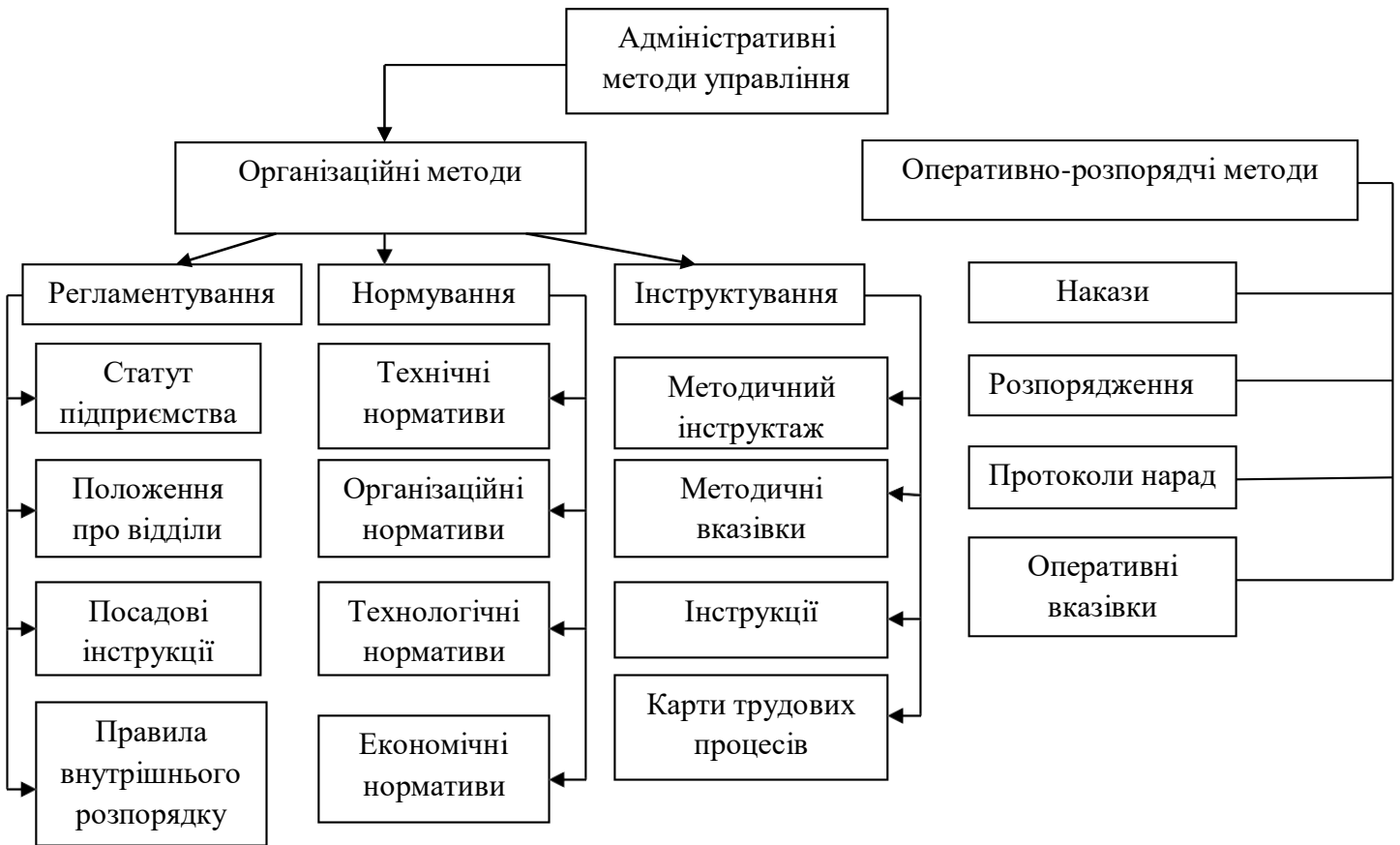
Рисунок 3.2 – Адміністративні методи управління

Над іншими частинами таблиці з абзацного відступу друкують «Продовження таблиці _____» або «Кінець таблиці _____» без повторення її назви.