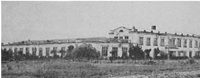
5-й навчальний корпус

розумінні національного колориту суто української архітектури, дбайливому ставленні до природного оточення, рельєфу мальовничої місцевості.