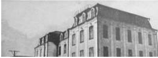
4-й навчальний корпус

У 1926-1931 рр. зодчий Д. Дяченко проектує комплекс споруд Київського сільськогосподарського інституту (нині — Національний університет біоресурсів і природокористування України) в Голосіївському районі столиці. Дослідники відзначають високу художню якість споруди Лісотехнічного факультету (1926-1927). Саме у комплексі будівель Університету талант зодчого виявився у тонкому