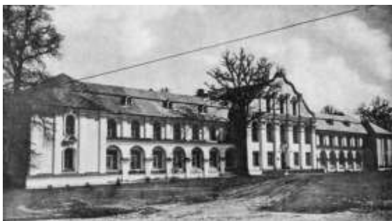
1-й навчальний корпус