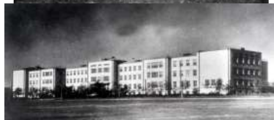
3-й навчальний корпус

Національний університет біоресурсів і природокористування України є провідним закладом вищої освіти аграрного спрямування, який у цьому році відзначає 125-річницю з дня заснування. Історія бере свій початок від сільськогосподарського відділення, яке було відкрите 30 вересня 1898 р. у Київському політехнічному інституті і трансформувалось у 1918 р. у сільськогосподарський (агрономічний)