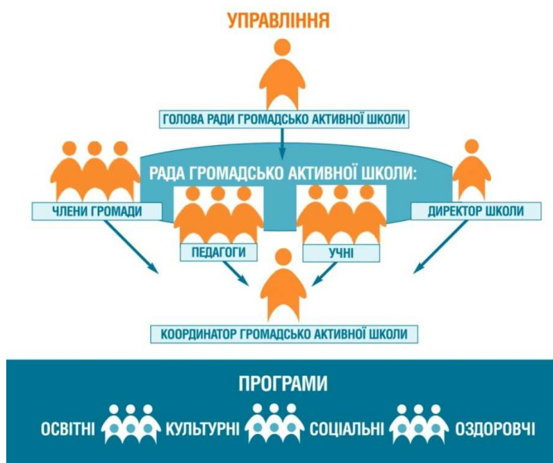
Рис. 1. Модель управління громадсько-активною школою

Діяльність ГАШ орієнтована на впровадження освітніх, культурних, оздоровчих та соціальних програм. Модель управління ГАШ подано на рис.1 [1].