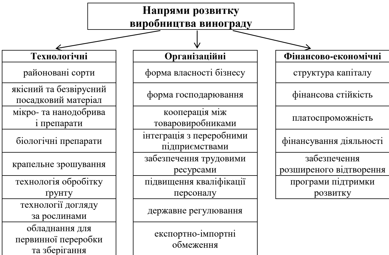
Рис. 2. Напрями розвитку виробництва винограду в сільськогосподарських підприємствах*

У роботі систематизовано напрями розвитку виробництва винограду в сільськогосподарських підприємствах (рис. 2).