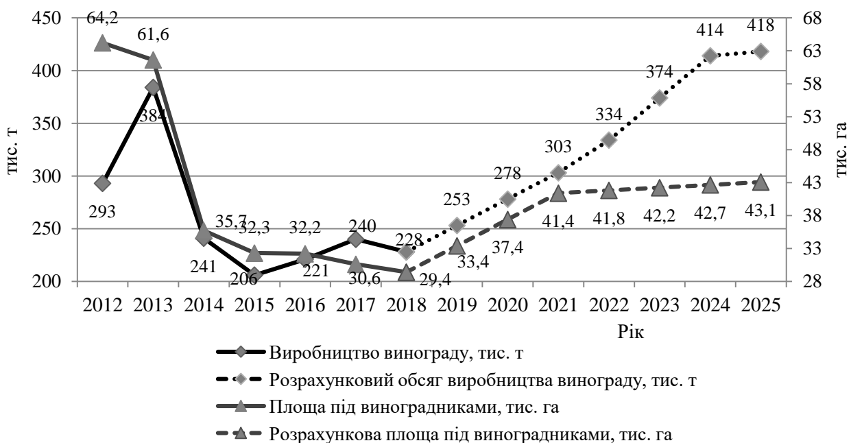
Рис. 4. Динаміка розвитку виробництва винограду в сільськогосподарських підприємствах України на перспективу*

Важливе значення у розвитку виноградарства відіграє державна підтримка галузі. Вона зорієнтована на інтенсифікацію із закладенням нових насаджень, що дозволить покращити ситуацію в галузі (рис. 4).