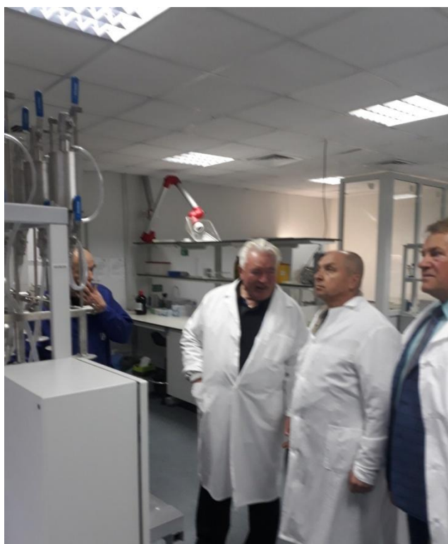
В фармако-кінетичній лабораторії