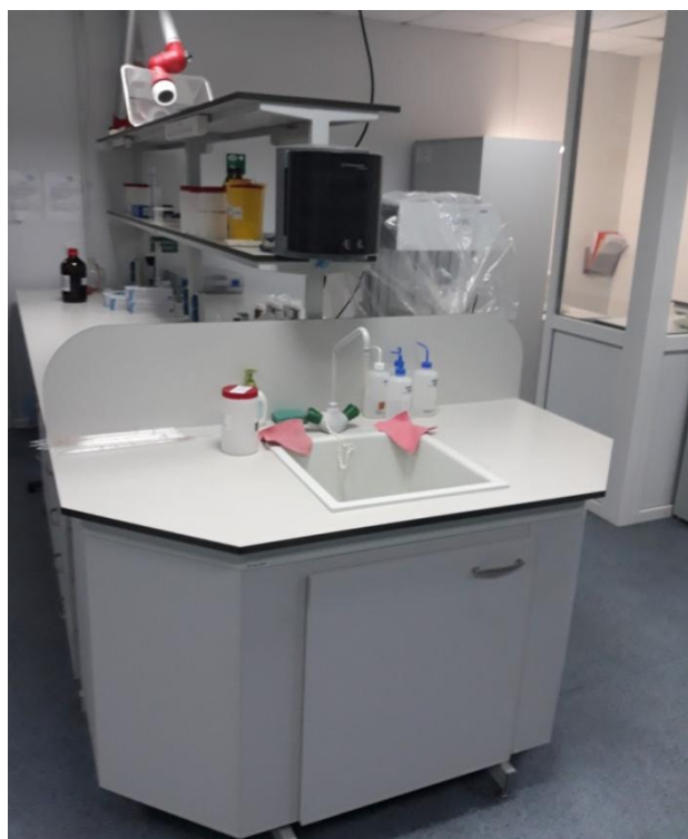
Прилад для отримання високочистого дистиляту