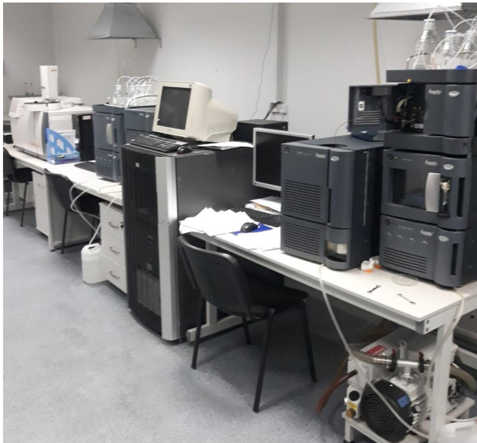
Високовартісне біохімічне обладнання лабораторії