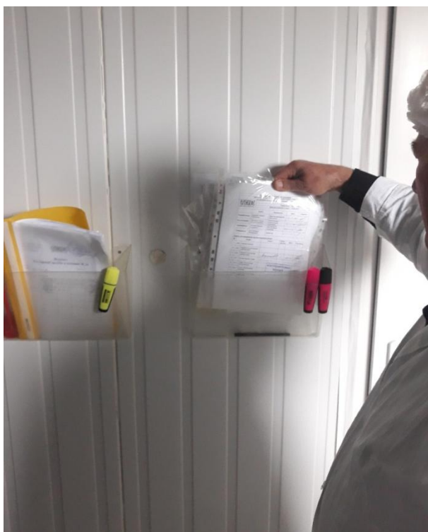
Такі бокси із СОПами – на кожному робочому місці

Особливу увагу приділили системі документообороту. Величезна кількість СОПів (стандартних операційних процедур) розроблених, розглянутих і затверджених в установленому порядку, надрукованих і розміщених на кожному робочому місці. Вони регламентують всі види діяльності кожного члена колективу (дослідника, ветлікаря, прибиральника тощо). Їх більше сотні. Це своєрідні інструктивні матеріали, за якими виконуються відповідні дії кожного на своєму робочому місці. Крім того, більше десятка реєстраційних журналів: входу в те чи інше приміщення лабораторії та виходу з нього, зберігання та видача реактивів, матеріалів, реєстрації показників тощо. Важливим є отримання і передача результатів досліджень – кожен результат із спектрометра чи будь-якого іншого приладу автоматично заноситься в компютер і тут же передається на центральний сервіс в м. Амстердамі (Нідерланди). Вся відео та інша інформація таким же чином передається на цей центральний сервер.