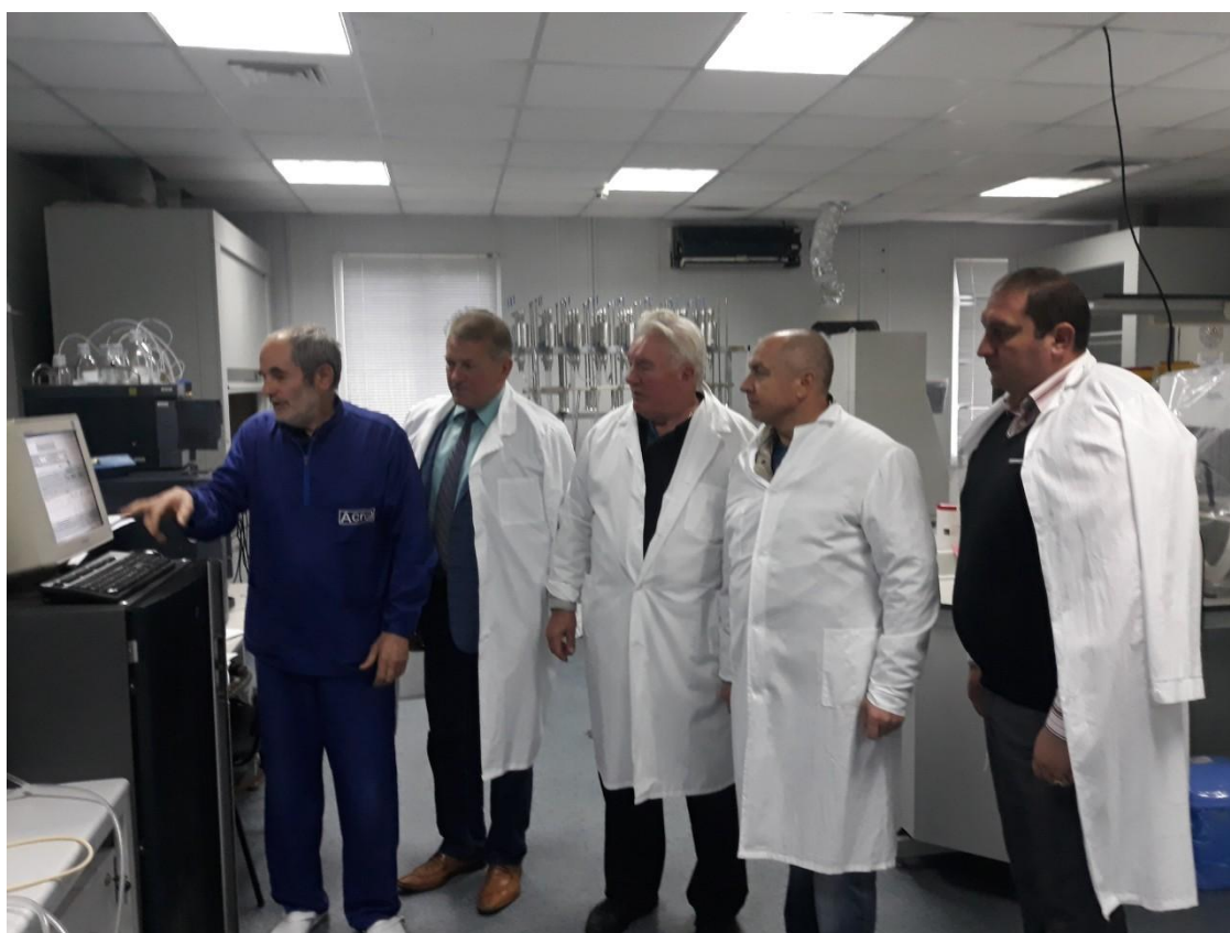
На компютері – вся інформація про дослідження on line