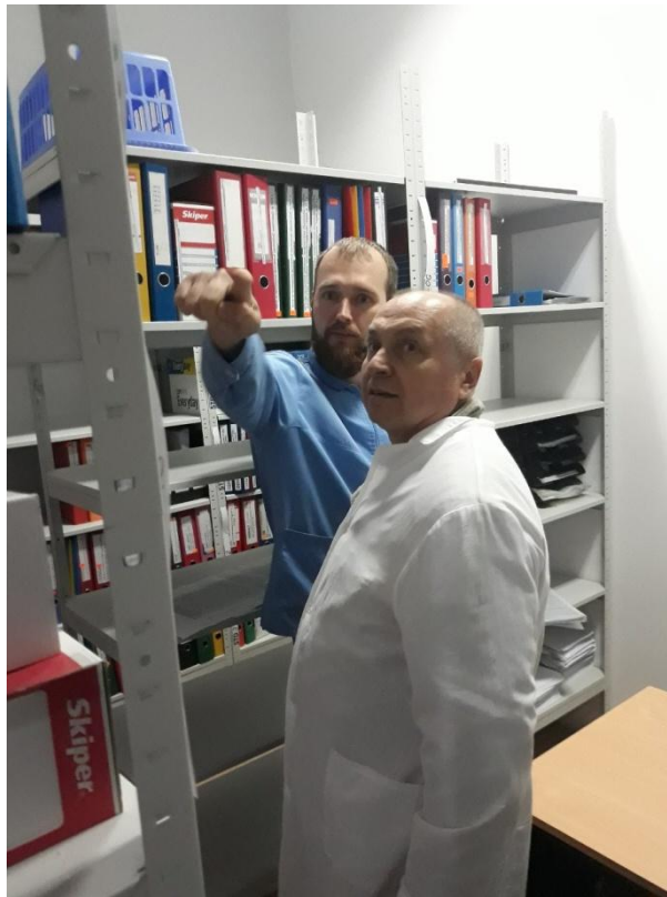
В архіві зберігаються всі документи впродовж трьох років