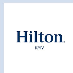
Готель Hilton Київ, Україна