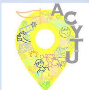
Асоціація дитячого та молодіжного туризму України