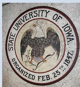
Університет штату Айова, США