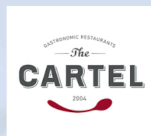
Холдинг CARTEL, Україна