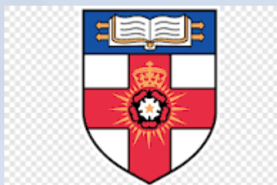
Школа гуманітарних наук Лондонського столичного університету