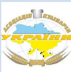
Асоціація кулінарів України