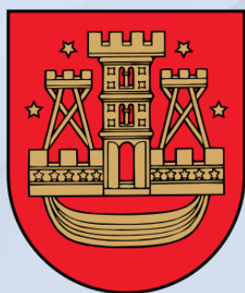
Клайпедський університет, м. Клайпеда, Литва