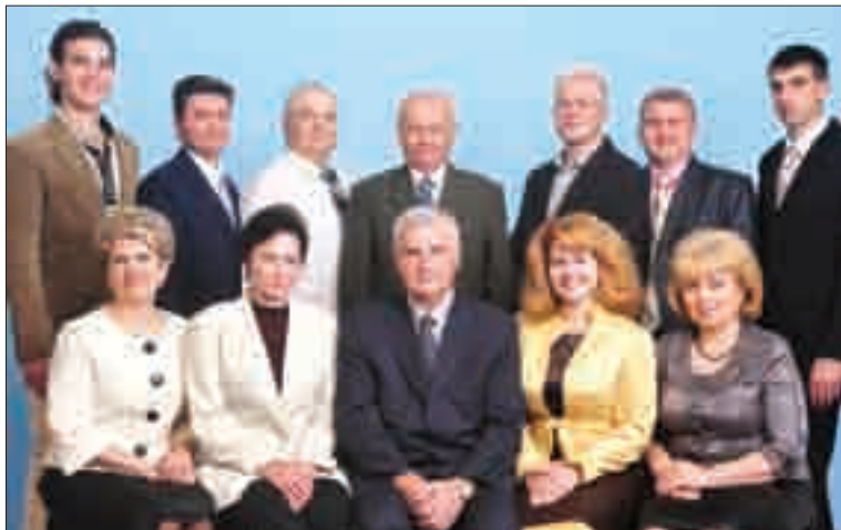
Кафедра механіки, опору матеріалів та будівництва (2-ге місце)