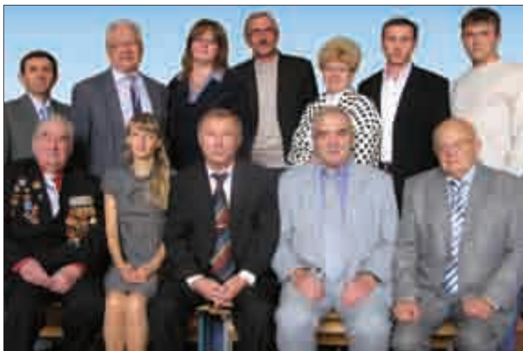
Кафедра процесів і обладнання переробки продукції АПК (8-ме місце)