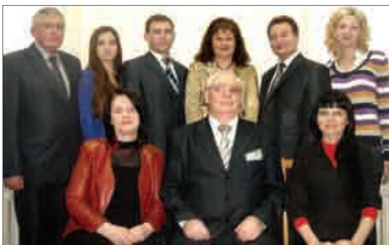
Кафедра управління земельними ресурсами (6-ге місце)