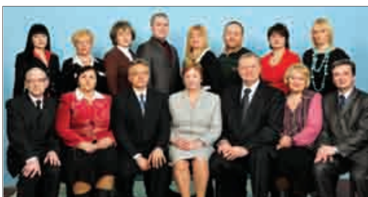
Кафедра розведення та генетики тварин ім. М.А. Кравченка (7-ме місце)