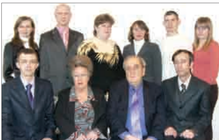
Кафедра аквакультури (4-ге місце)