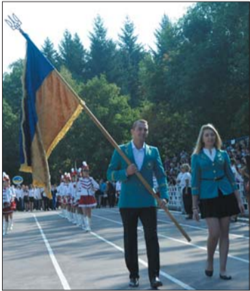
Продовження. Поч. на стор. 1

має великі міжнародні зв'язки. Лише за минулий навчальний рік 195 викладачів відвідали іноземні вищі, 238 студентів та аспірантів направлені за кордон на навчання чи стажування. Понад 600 студентів пройшли навчальні практики за кордоном.