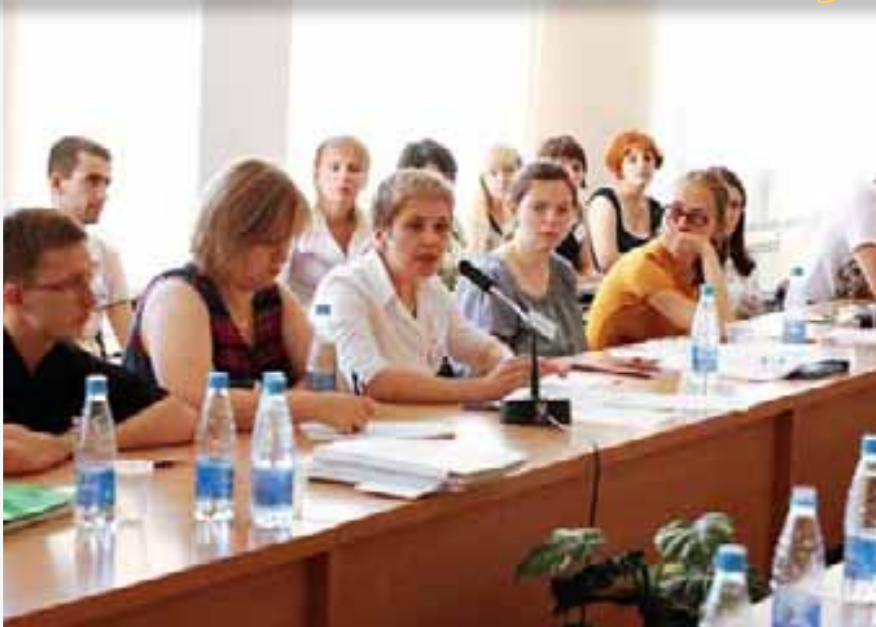
Pre-Departure Orientation for Ukrainian Fulbright Scholars, 21 June 2010

During the 2010 competition both programs boasted an increase in applicants of nearly 20%, raising the total from the previous 280 in 2009 to 335. These include the usually high number of applications for master's programs (from 241 to 281) as well as an increase in young scholars and lecturers submitting research projects for the Fulbright Faculty Development Program (FFDP) (from 39 to 54).