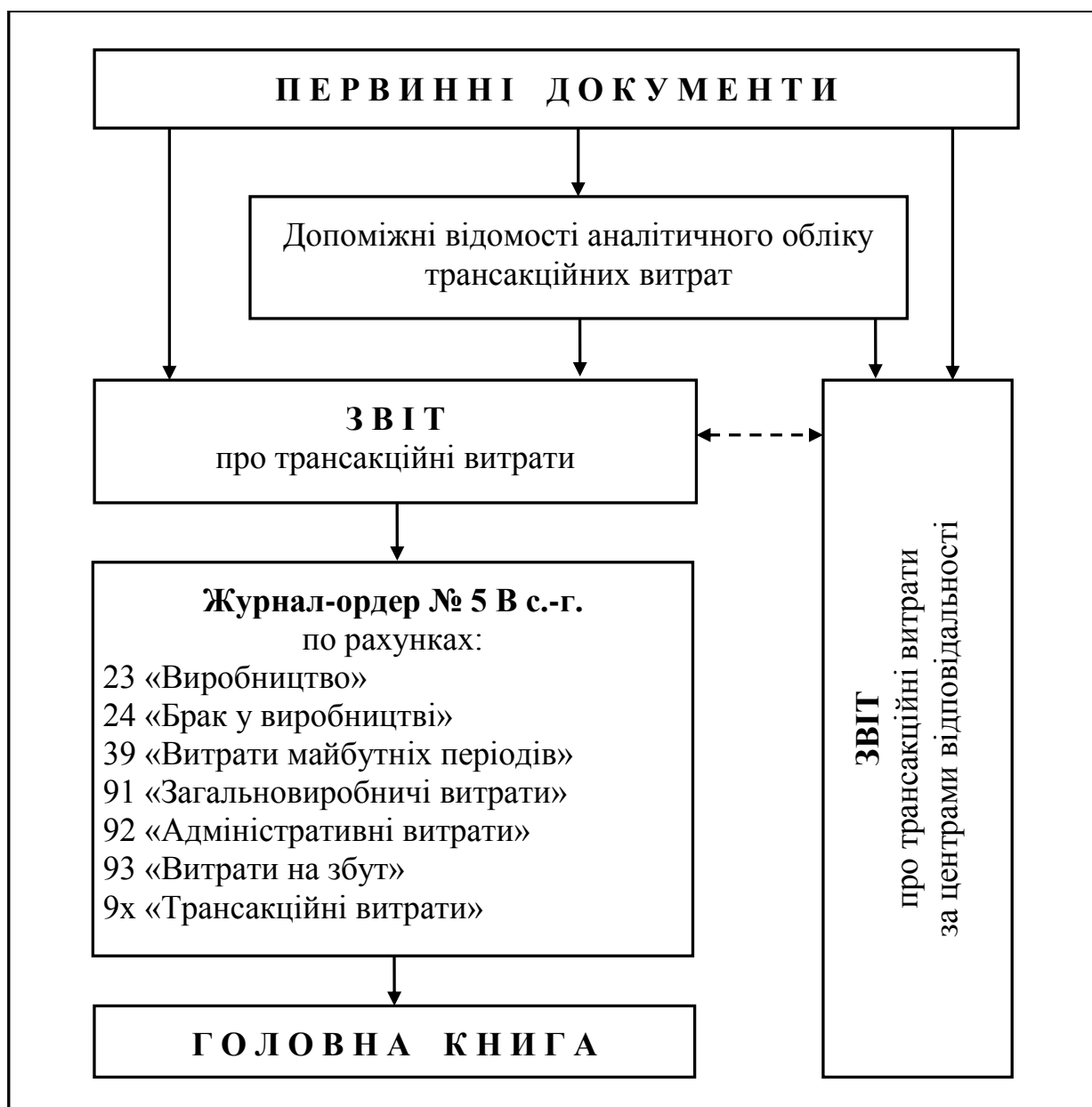
Рис. 2. Документальне підтвердження записів у обліку трансакційних витрат.

обґрунтованості, ефективності та правомірності здійснення трансакційних витрат.