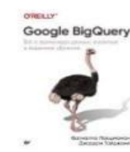
«Google Analytics Thin Edition Joe Teixeira» from L. Ledford and Mary Tyl