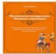
«Google BigQuery. Все о хранилищах данных, аналитике и машинном обучении» от Вальяппа Лакшманана и Джордана Тайджани