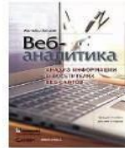
Веб-аналітика: аналіз інформації про відвідувачів веб-сайтів. Авінаш Кошик. 2010