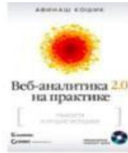
Веб-аналітика 2.0 на практиці. Тонкощі і кращі методики. Авінаш Кошик. 2012