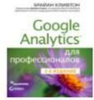
«Google Analytics для професіоналів» от Брайана Клифтона