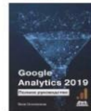
«Google Analytics 2019: Полное руководство» от Якова Осипенкова