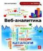
Веб-аналітика. Марк Хасслер. 2010