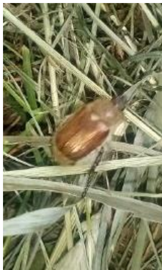
Клас: Комахи Родина: Пластинчастовусі Вид: M. melolontha