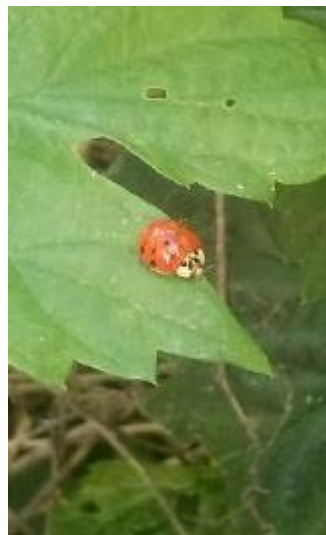
Клас: Комахи Родина: Сонечка Вид: Гармонія азійська