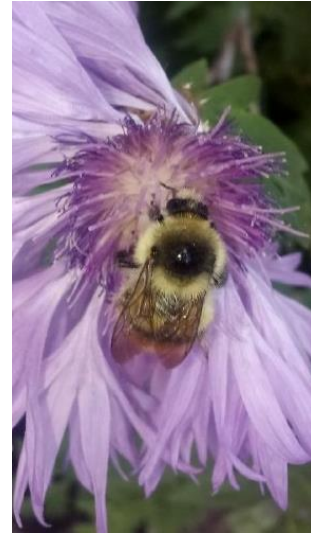
Клас: Комахи Родина: Бджолині Вид: Джміль земляний