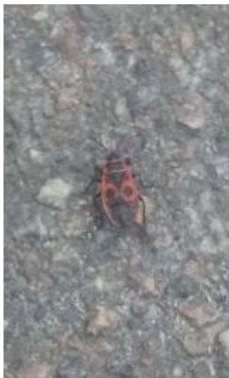
Клас: Комахи Родина: Червоноклопи Вид: P. apterus

Були обстежені ділянки біля житлових будинків, польова місцевість та невеликі зарощі чагарників. У великій кількості було виявлено такі види як червоноклоп червоний, хрущ травневий, різноманітні сонечка та їх личинки. Також налічувалось багато равликів.