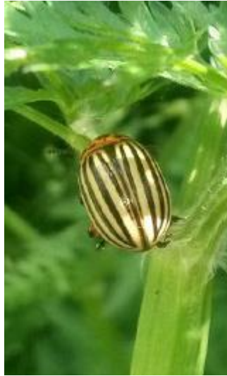
Клас: Комахи Родина: Листоїди Вид: Колорадський жук