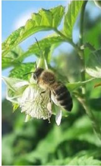
Клас: Комахи Родина: Бджолині Вид: Бджола медоносна

Були обстежені культурні рослини, такі як картопля та вишня, а також квіткові рослини. На листках картоплі у великій кількості паразитували Колорадські жуки, їхні личинки та яйця, а деякі листки вишні були майже чорні від тлі, яка на них паразитувала. На квітках було багато запилювачів – бджіл та джмелів.