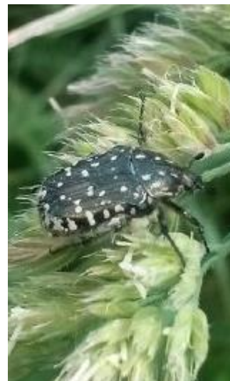
Клас: Комахи Родина: Пластинчастовусі Вид: Бронзівка смердюча