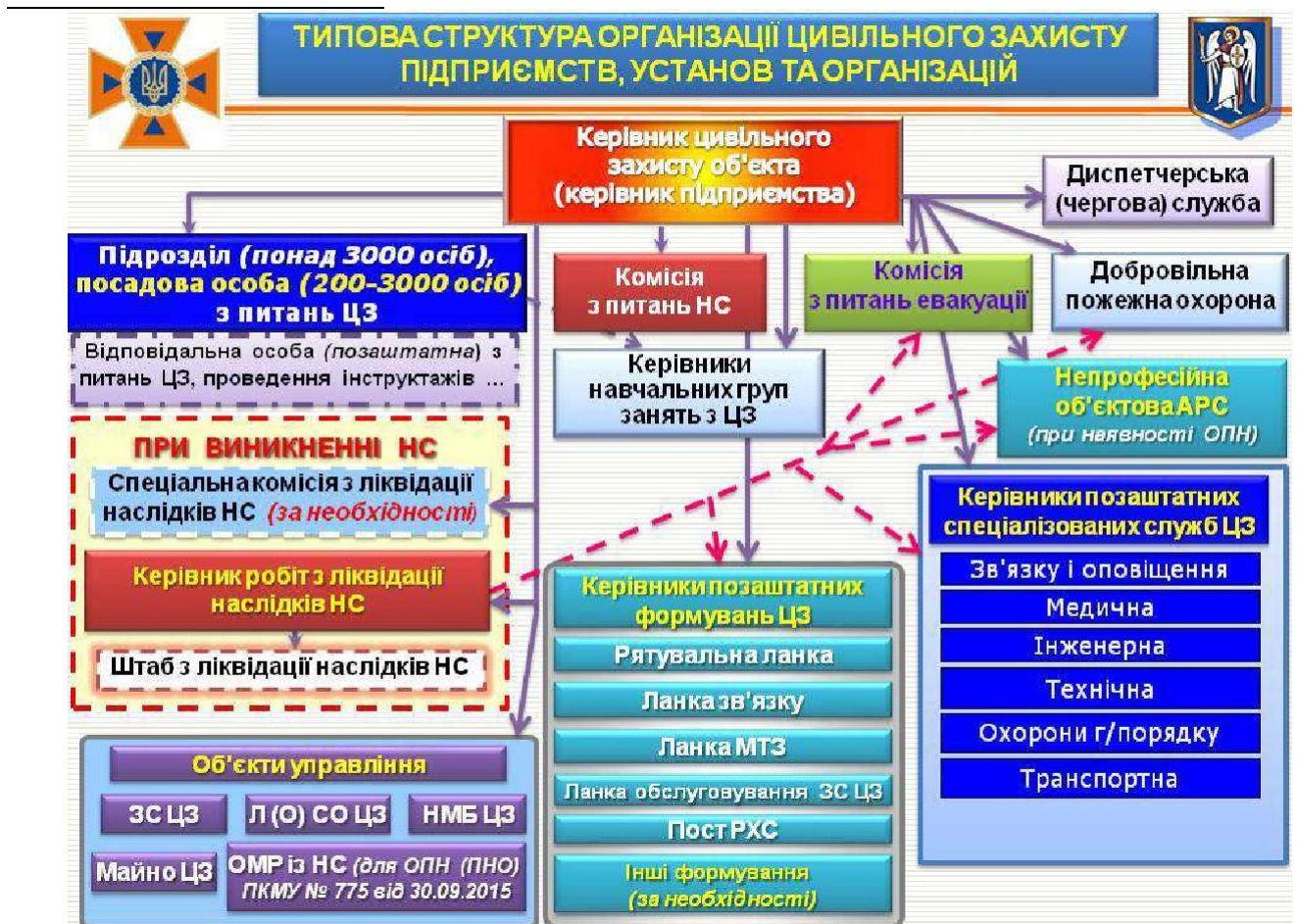
Рис. 2 – Типова структура організації цивільного захисту суб'єкта господарювання

Громадяни України, іноземці та особи без громадянства, які здійснюють господарську діяльність та зареєстровані відповідно до Закону як підприємці, виконують заходи цивільного захисту особисто.