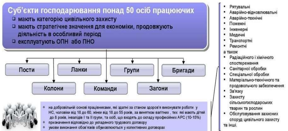
Рис. 1 - Об'єктові формування цивільного захисту

У Порядку утворення, завдання та функції формувань цивільного захисту, затвердженому постановою Кабінету Міністрів України від 9 жовтня 2013 р. № 787, визначено, що об'єктові формування цивільного захисту утворюються суб'єктами господарювання, які мають чисельність працюючого персоналу понад 50 осіб та володіють транспортною, будівельною, комунальною, медичною, пожежною та іншою спеціальною технікою і відповідають одній з таких умов: