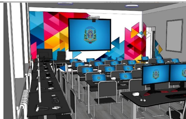
Проект лабораторії віртуальної та доповненої реальності

Студентами гуртка були зроблені 3Д скани дерев'яних статуй для майбутнього проекту по створенню віртуальної версії ботанічного саду НУБІП.