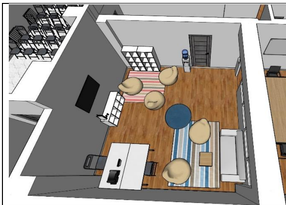
Проект студентського артпростору

В рамках роботи гуртка віртуальної доповненої та змішаної реальності в 2023 році був виконаний ряд робіт, проектів та наукових публікацій студентів учасників гуртка. Зокрема, на прохання ректорату університету та студентської організації був розроблений проект студентського арт простору що базуватиметься в студентській столовій з можливістю ого огляду в віртуальному просторі. Також був розроблений проект лабораторії віртуальної, доповненої та змішаної реальності в 220 аудиторії 11 корпусу. За розробленими планами був виконаний ремонт, відкриття планується на річницю від дня народження університету.