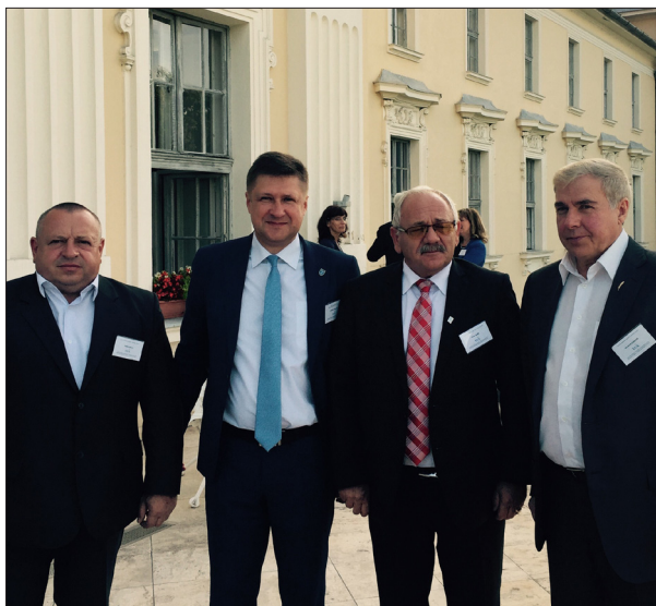
VUA General Meeting 2016 Szent Istvan University, Godollo, Hungary (18-20.09.2016)