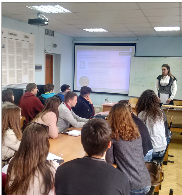
Зустріч представника ОТП банку зі студентами економічного факультету, 2016 рік