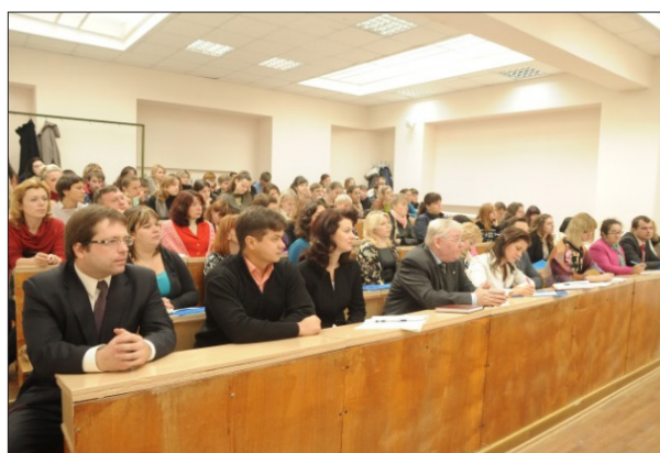
Проведення Міжнародної науково-практичної конференції «Фінансово-економічний механізм ефективного функціонування аграрних підприємств» (1–2 жовтня 2015 року) м. Київ, НУБІП України