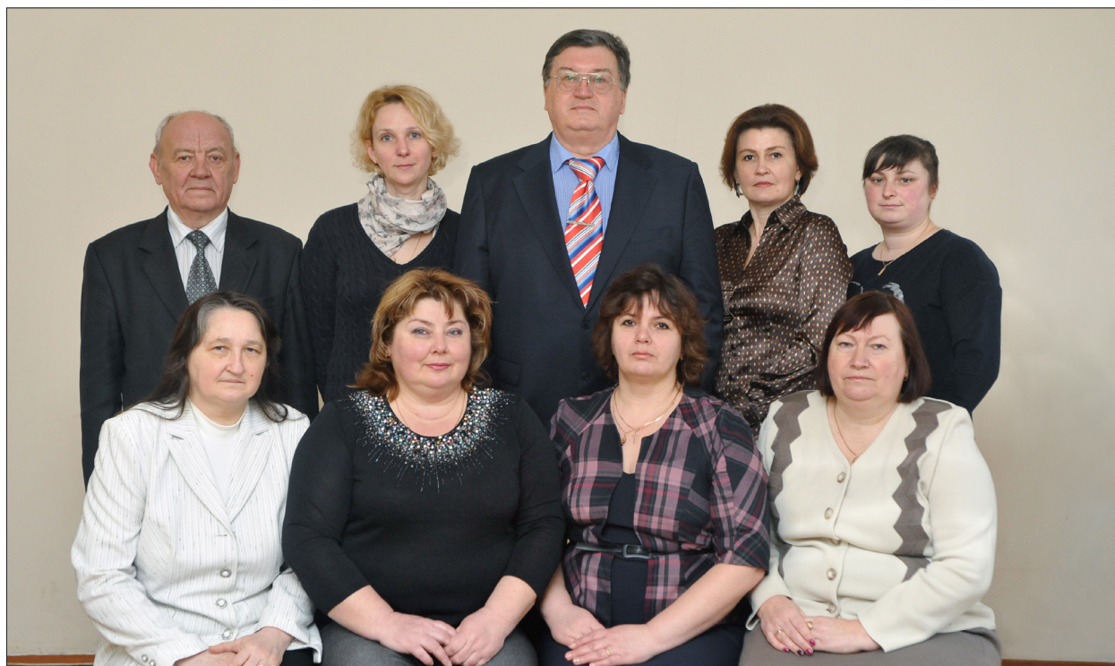
Колектив кафедри вищої математики, 2016 рік

Кравчука М. П. провідне місце також належить розробці україномовної математичної термінології та створенню курсу вищої математики безпосередньо для сільськогосподарських навчальних закладів. З 2010 р. кафедра носить ім'я видатного математика сучасності, академіка Кравчука М. П.