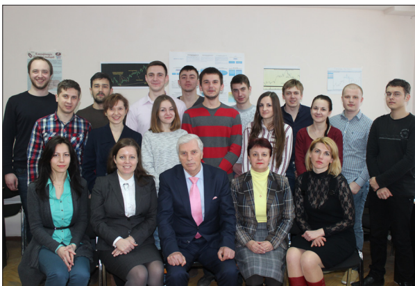
Колектив кафедри біржової діяльності з магістрами спеціальності «Біржова діяльність», 2015 рік