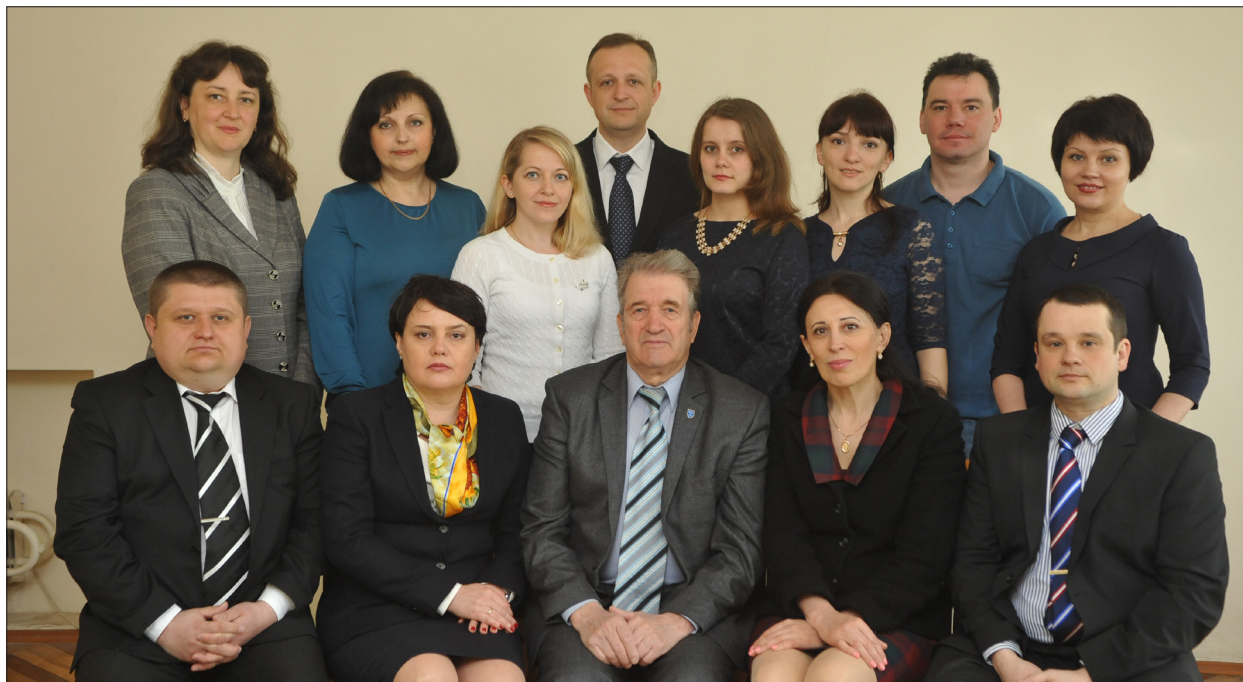
Колектив кафедри статистики та економічного аналізу, 2016 р.

Нині кафедра статистики та економічного аналізу здійснює навчальний процес на різних факультетах та ННІ університету, готуючи фахівців зі спеціальностей «Економіка», «Облік і оподаткування», «Фінанси, банківська діяльність та страхування» ОС «Бакалавр» і «Магістр» для різних галузей національної