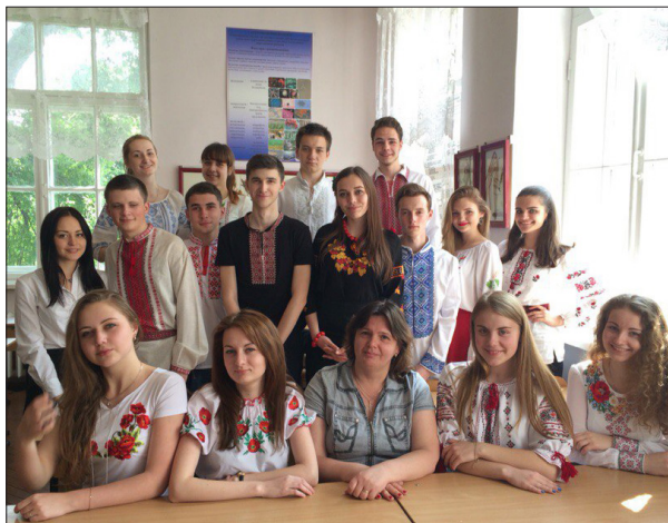
Іспит з Вищої математики, 2016 рік