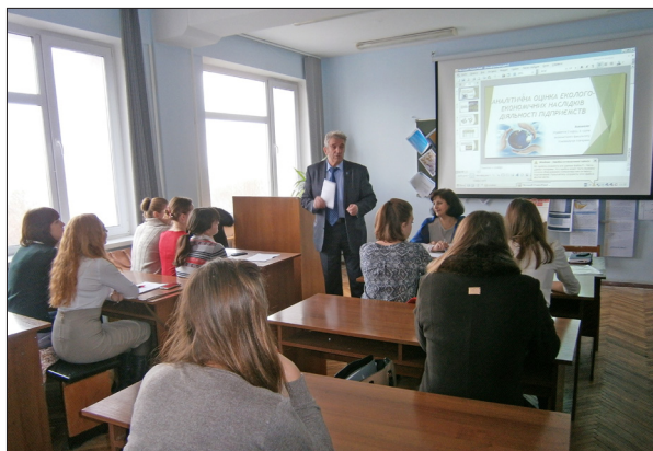
Секційне засідання 69-ї науково-практичної студентської конференції «Стратегія розвитку аграрного сектору економіки України в умовах євроінтеграційних процесів», 2015 рік

Кафедра активно займається підготовкою аспірантів і докторантів. Після 1995 року захищено 1 докторську та 24 кандидатські дисертації.