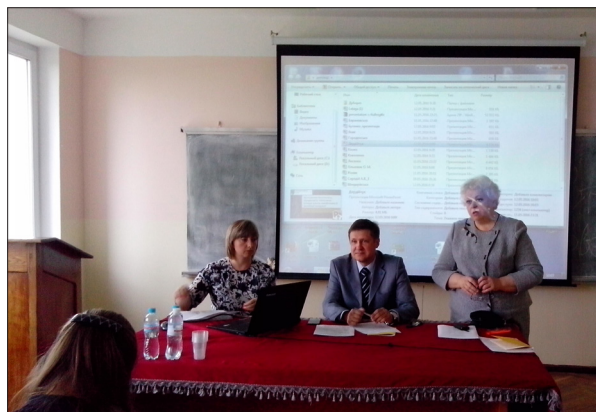
Проведення Всеукраїнської студентської науково-практичної конференції «Бухгалтерський облік, контроль та аналіз в управлінні господарською діяльністю та оподаткуванням підприємств» (12 травня 2016 р.), м. Київ, НУБіП України

Постійно проводяться спільні заходи з Федерацією професійних бухгалтерів та аудиторів України, видавництвом газети «Все про бухгалтерський облік», ННЦ «Інститут аграрної економіки» України, ДННУ «Академія фінансового управління»