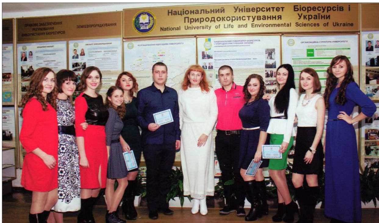
Випуск студентів ОС «Магістр» спеціальності «Фінанси і кредит» спеціалізації «Фінансова аналітика у сфері бізнесу», 2015 рік

тодичних праць. Її основними науковими інтересами є корпоративні фінанси та фінансова безпека в агробізнесі.