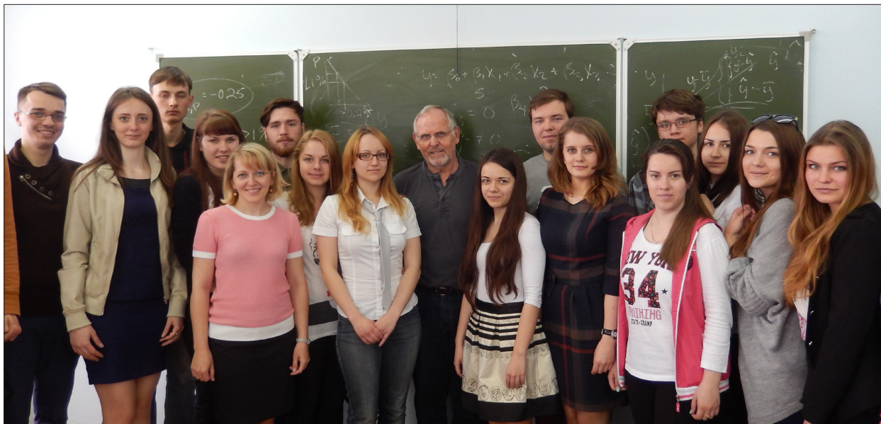
Учасники лекції «Перевірка статистичних гіпотез», прочитаної професором Університету штату Огайо (США) Стенлі Томпсоном , 2015 рік

економіки. У зв'язку з ускладненням управління в умовах невизначеності та збільшення ризиковості господарювання кафедра готує магістрів за програмою «Стратегічний облік та бізнес-соціальна аналітика».