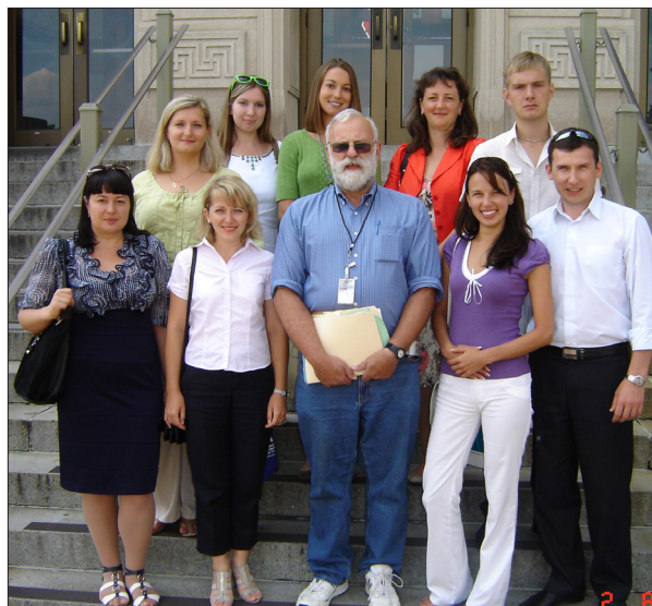
Зустріч учасників програми обміну Faculty Exchange Programs, США (2015 р.)

програми обміну студентів в університетах-партнерах (за програмою Erasmus Mundus Alракis2 Action 2, програмою ЮНЕСКО (країни ЄС), Faculty Exchange Program - FEP), Міжнародна програма досліджень у сільському господарстві спонсорована сім'єю Воскобів (США), в рамках Європейської програми мобільності «Erasmus+» та «Польський Erasmus для України»;