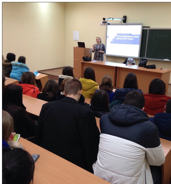
Відкрита лекція представника Фонду гарантування вкладів фізичних осіб для студентів економічного факультету, 2016 рік

своїй діяльності, відповідно до визнаної у світі уніфікації інституційних секторів розглядаються окремо як основні суб'єкти фінансової системи і мають суттєву специфіку функціонування, яка потребує особливих підходів до навчання та наукового осмислення.