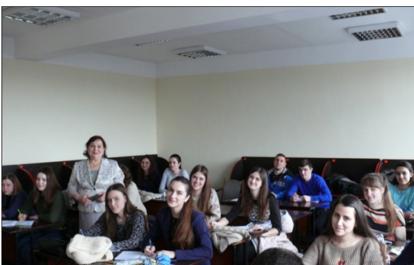
Девіз кафедри: Вчити і навчатися із задоволенням