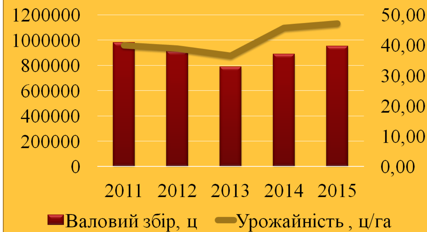
Рис. 1 Динаміка валового збору та урожайності зернових в господарствах Новоград-Волинського району, 2011-2015р.р

Предметом є теоретико - методичні засади економічної ефективності та конкурентоспроможності вирощування у сільськогосподарських підприємствах.