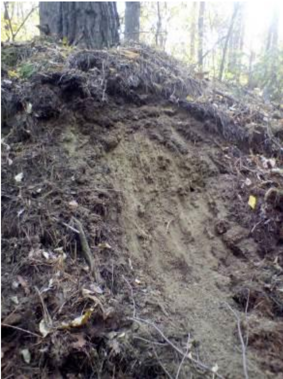
Рис. 2. Ґрунтовий профіль у насадженнях буровугільного кар'єру (кв. 90, вид. 4)

Головною причиною ослаблення соснових насаджень є переміщені ґрунти, родючий шар яких складає лише 20-40 см (рис. 2). Рослинам не вистачає поживних речовин, що призводить до їх ослаблення, і як наслідок ураження кореневою губкою, осередки якої відмічено у насадженнях старшого віку (рис. 3).