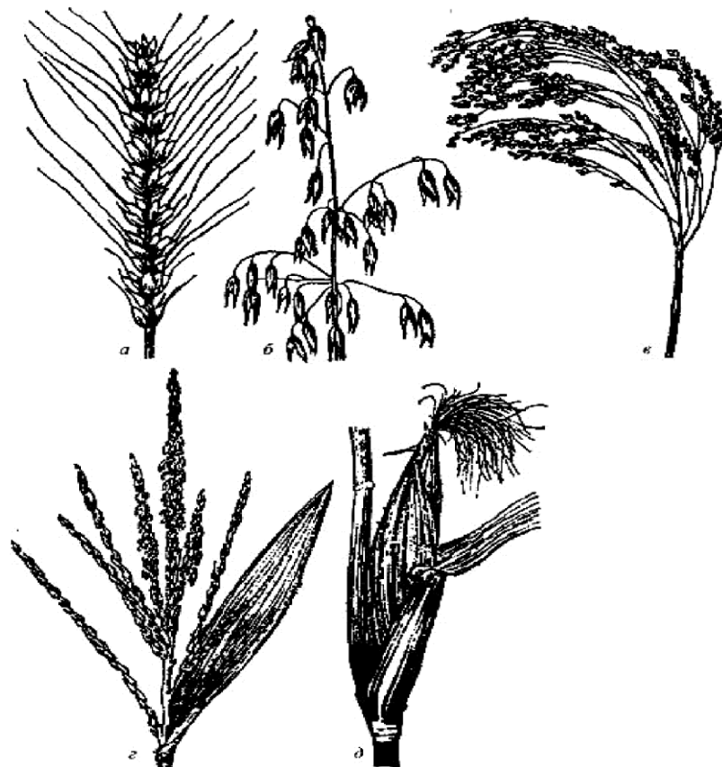
Рис. 5. Суцвіття злакових рослин: