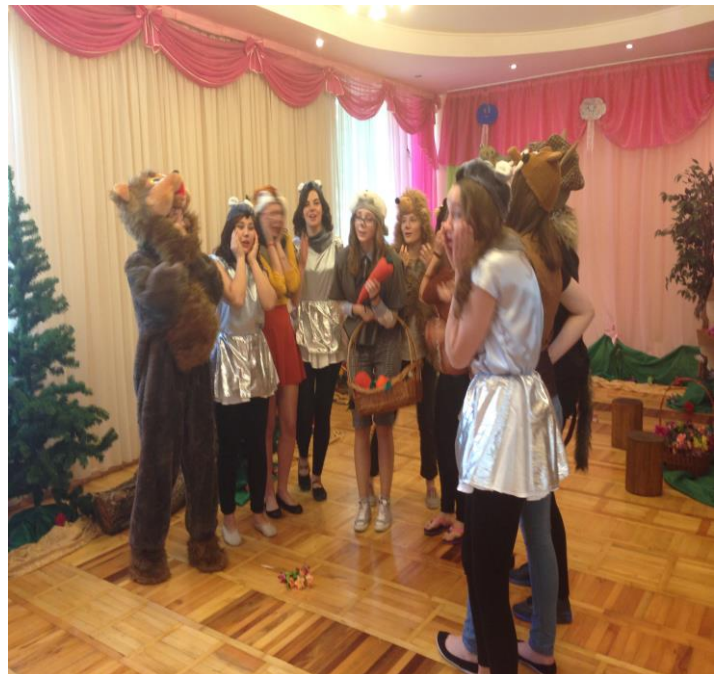
Герої вистави «Пан Коцький»