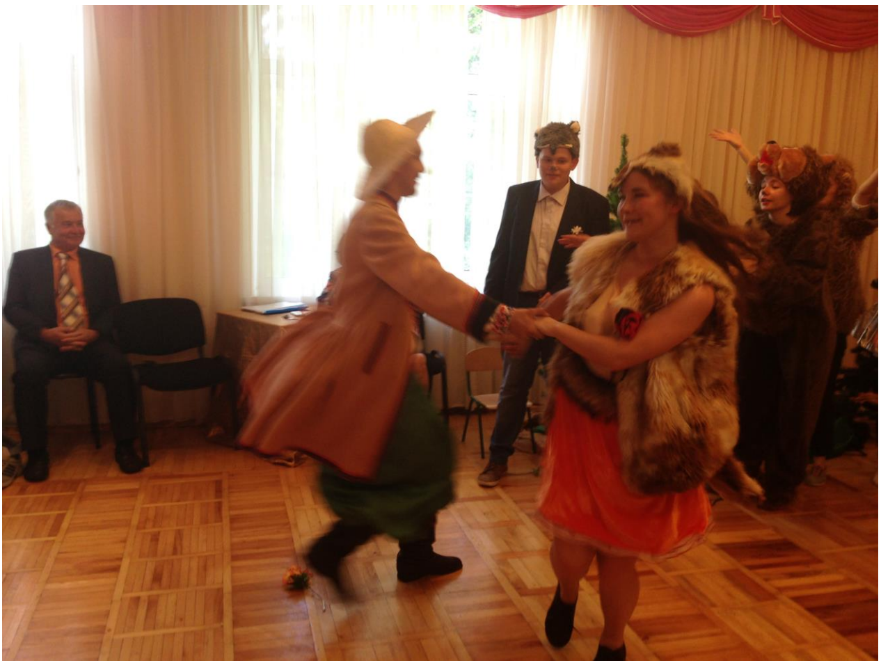
Студенти зуміли захопити аудиторію своїми піснями і танцями