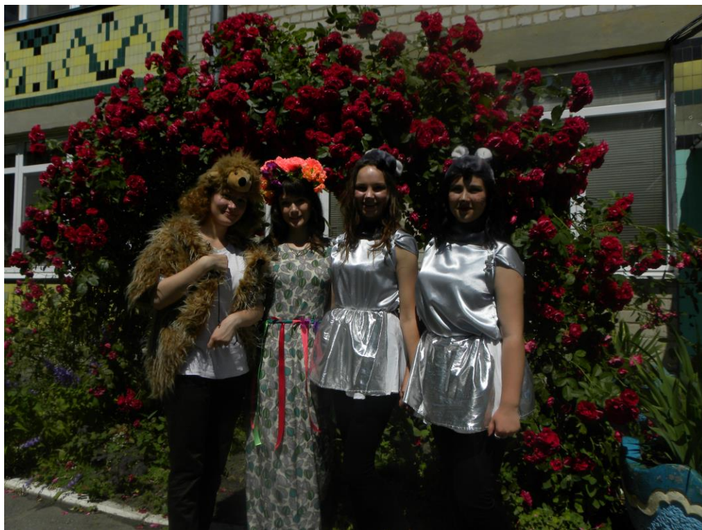
На території ДНЗ «Яблучко»