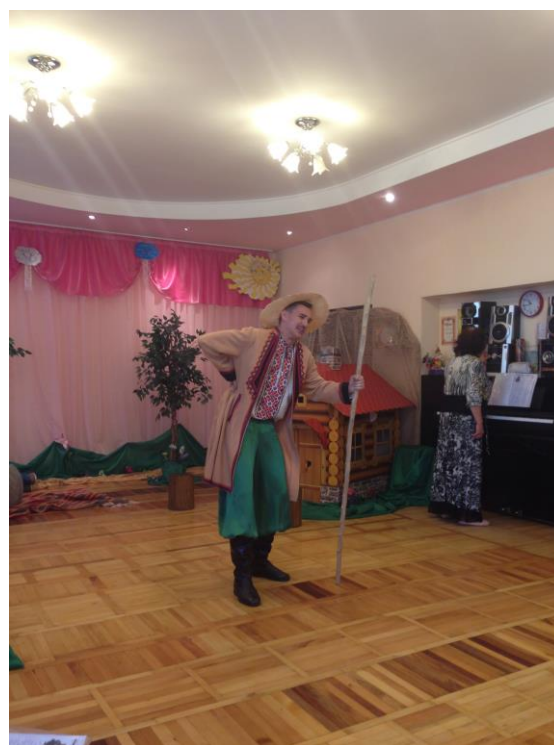
Герої казки: літечко і господар