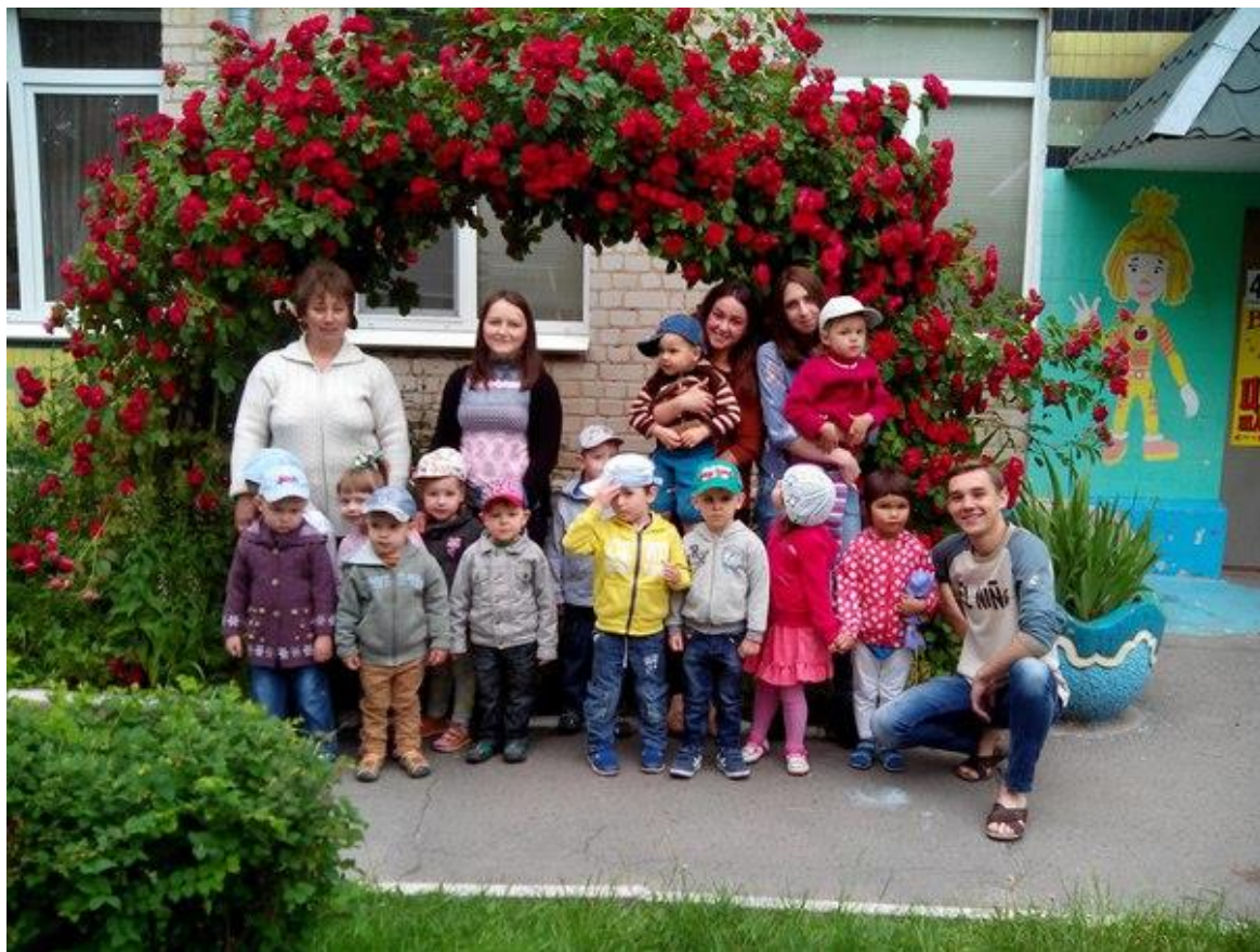
Маленькі вихованці зі своїми наставниками

природи, чарівний світ книги і навчальна база, де кожен малюк може вибрати собі заняття до вподоби, а студент – здобути практичні знання.